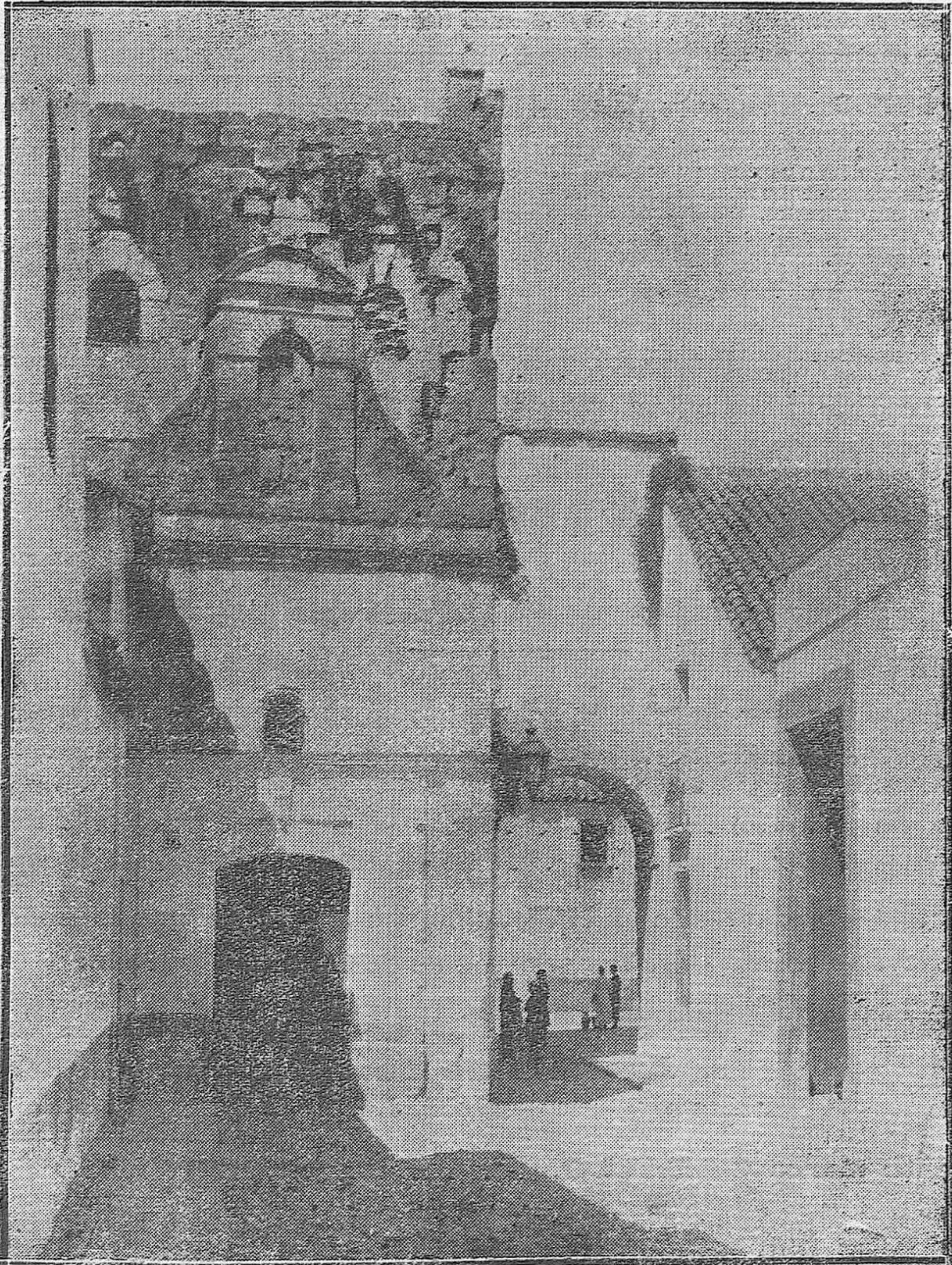
RINCONES DE CORDOBA.—EL PINTORESCO ARCO DE BELEM, EN EL TIPICO BARRIO DE ALCAZAR VIEJO.