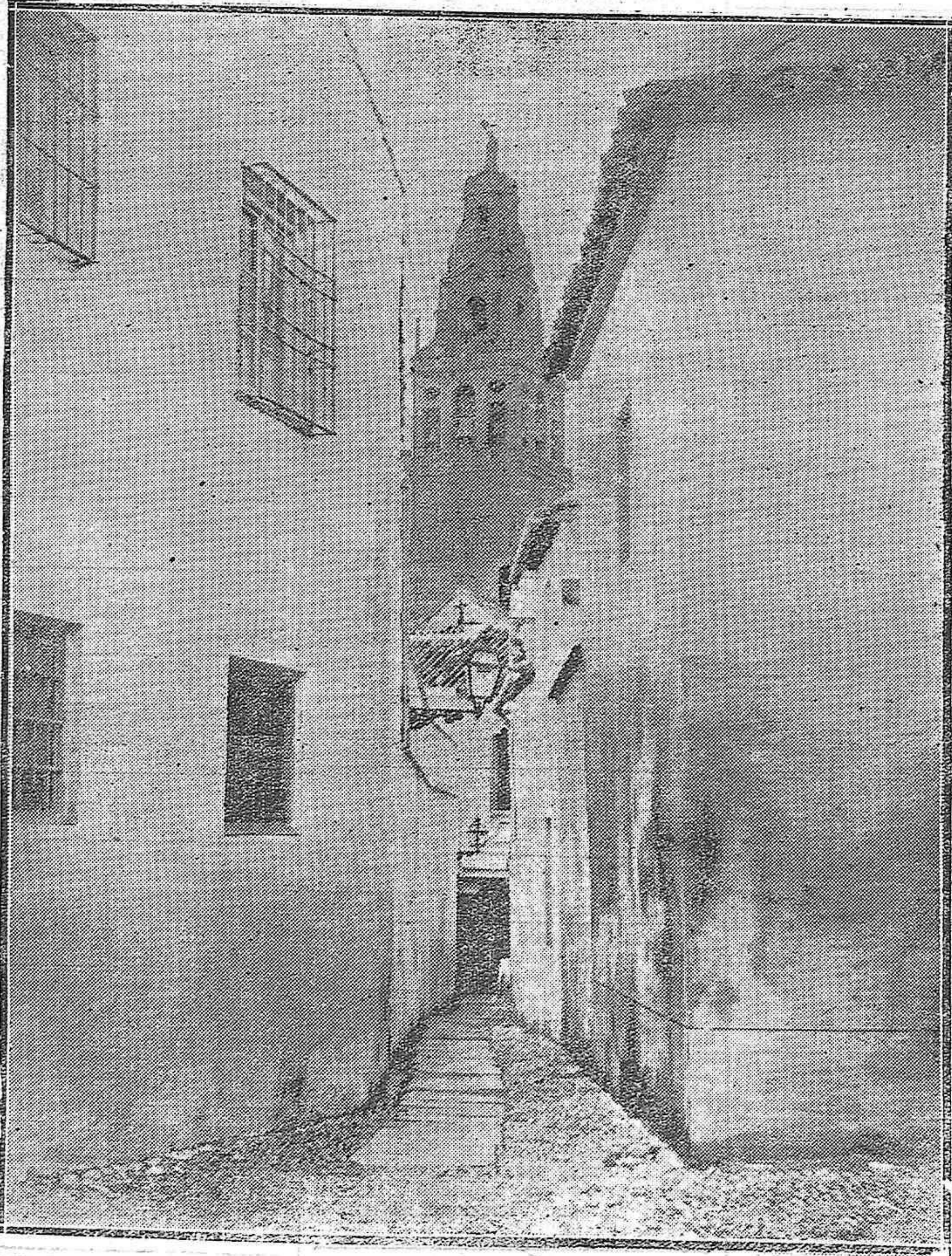
CORDOBA.—LA TORRE DE NUESTRA MEZQUITA, DESDE UN PUNTO DE VISTA SINGULAR.