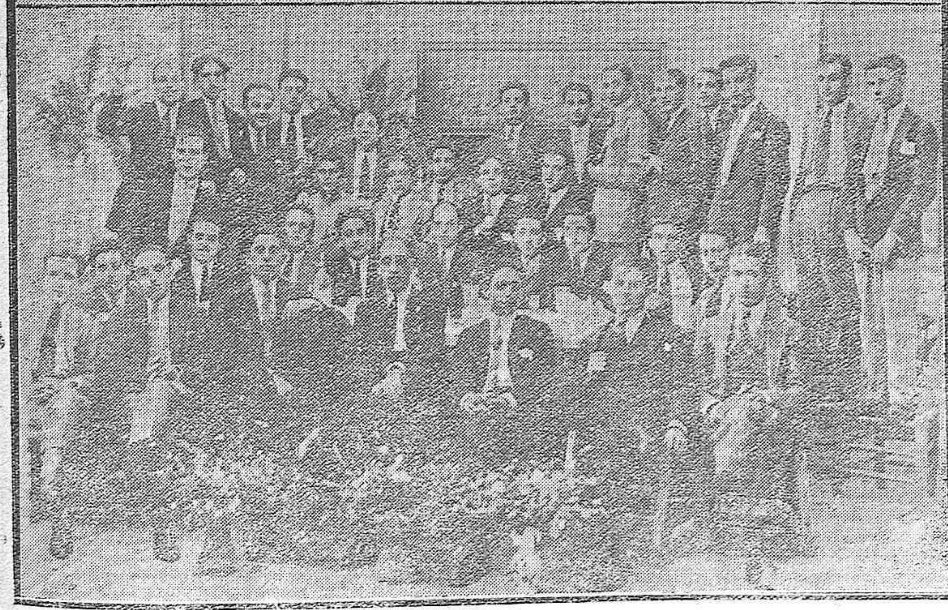
NOTAS GRAFICAS DE AYER. -- (1) EL señor Barbudo rodeado de los maestros que asistieron en San Rafael a la fiesta del Magisterio.-- (2) Miembros de la simpática agrupación denominada «Juventud Recreativa» que celebraron con un banquete el segundo aniversario de su fundación.