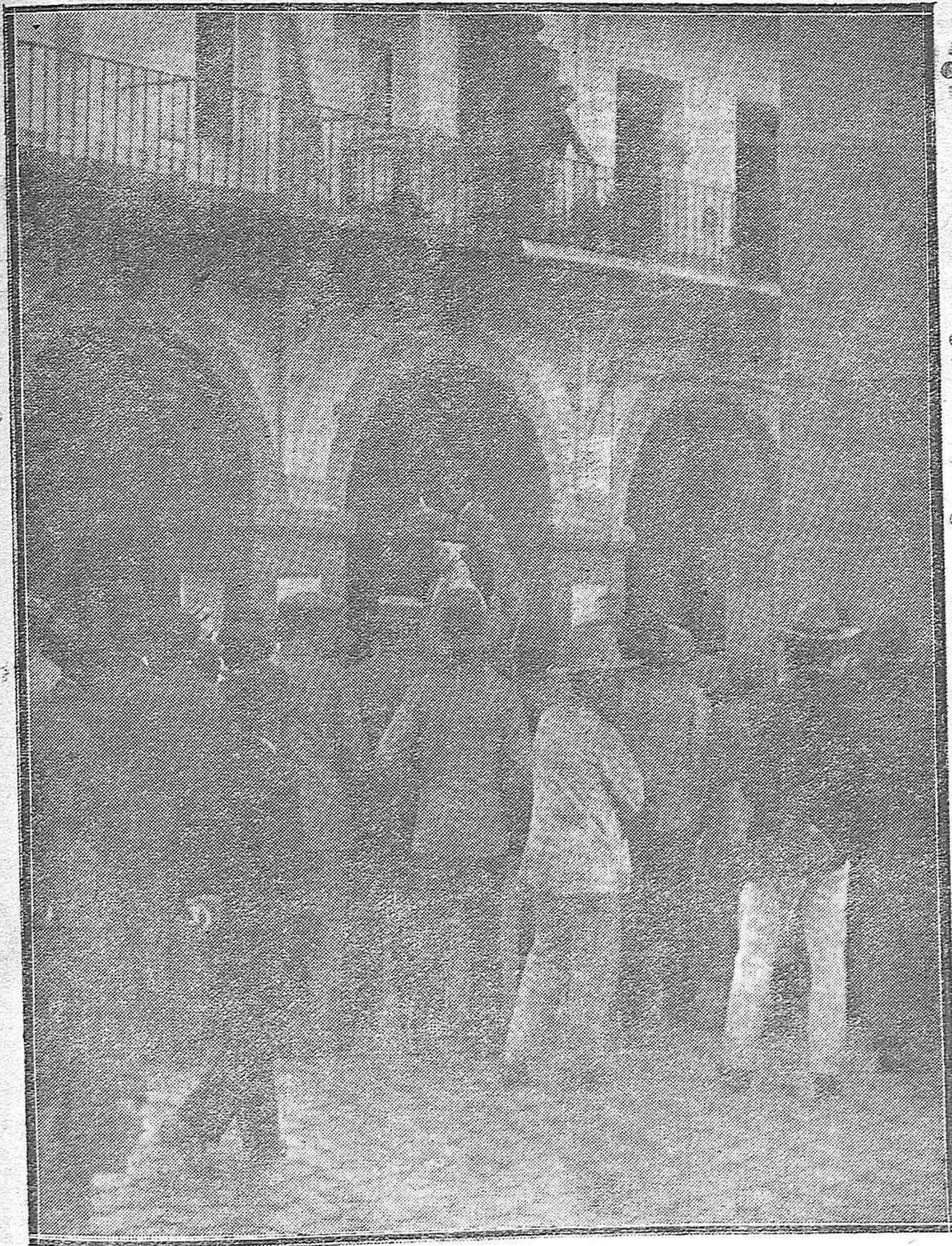
ESCENAS DE LA VIDA CALLEJERA.--El sempiterno «sacamuelas», orador ultramoderno, convenciendo a la concurrencia de la infalibilidad de su «panacea» única en el mundo.