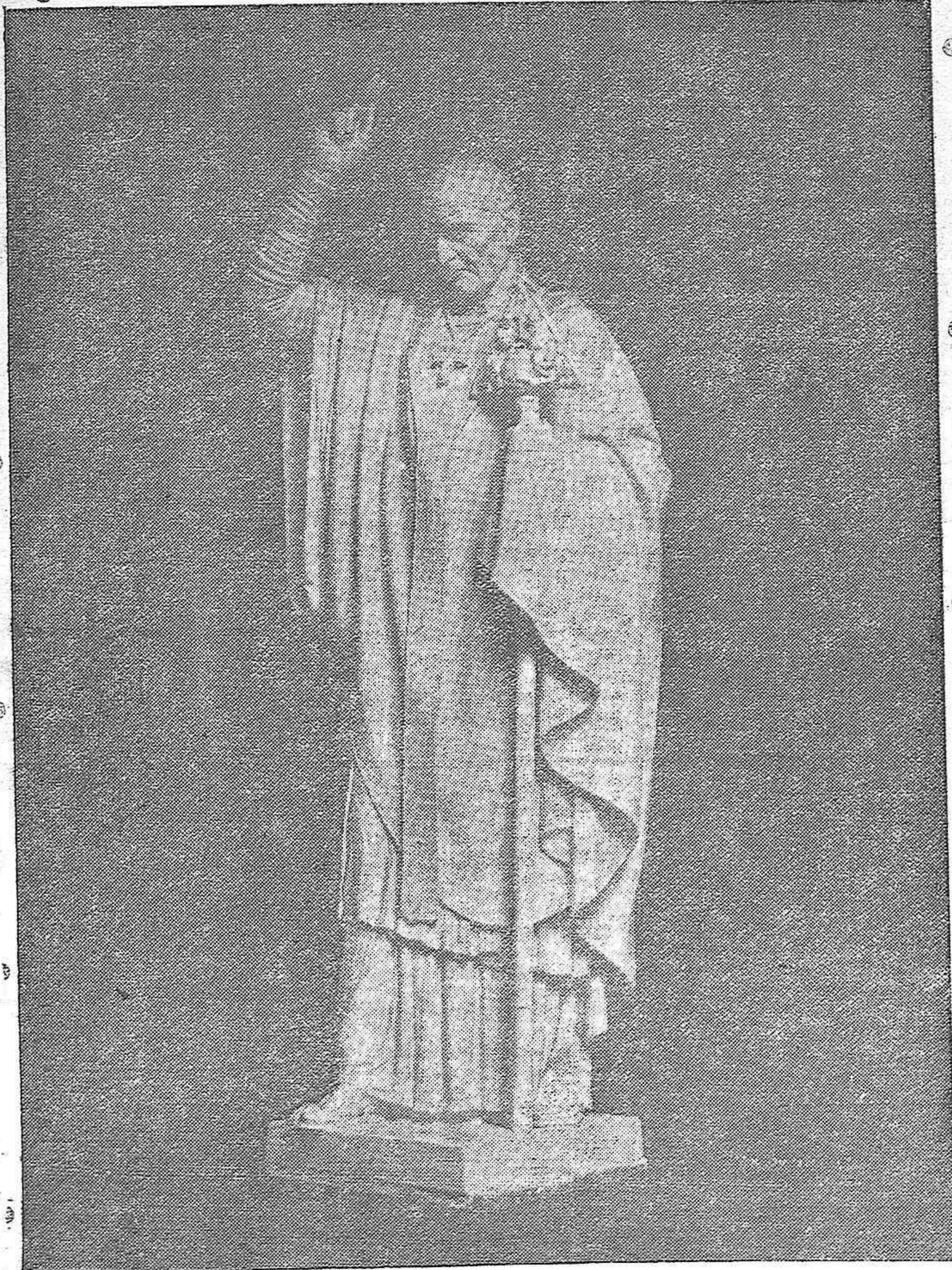
Estatua de Osio, por Lorenzo Coullaut Valera, que corona el monumento dedicado por el Ayuntamiento de Córdoba al inmortal obispo cordobés.