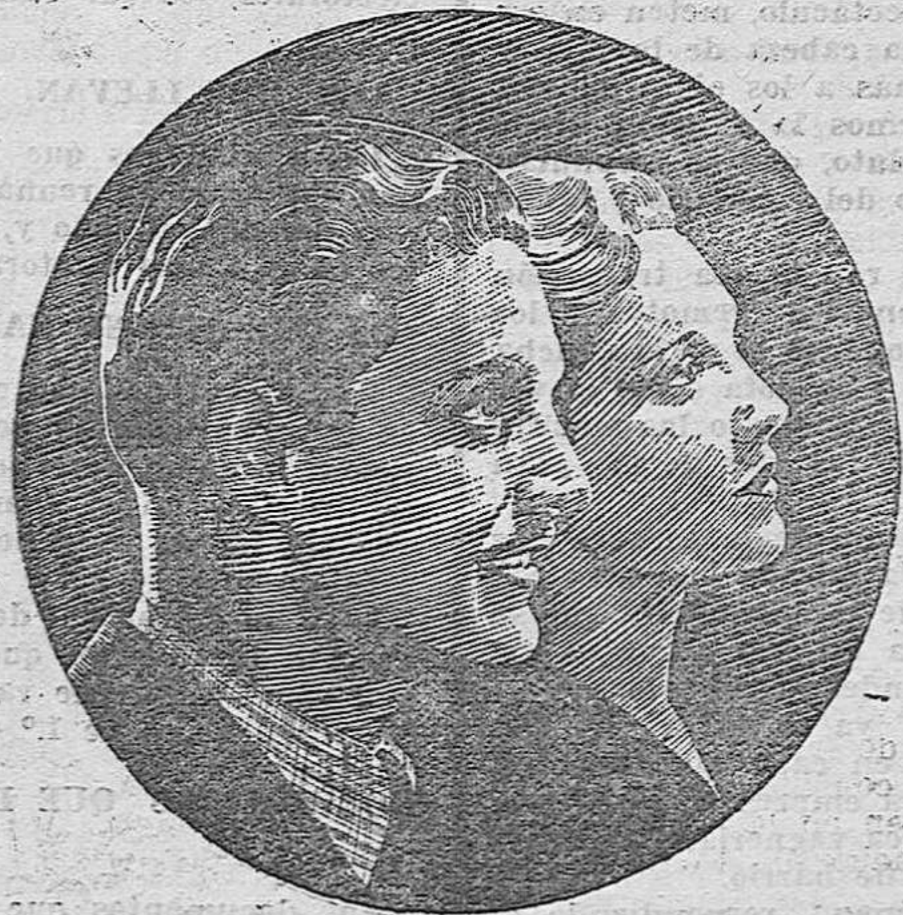
Madeleine Carroll y Robert Donald en un primer plano del film Atlantic "39 Escalones".