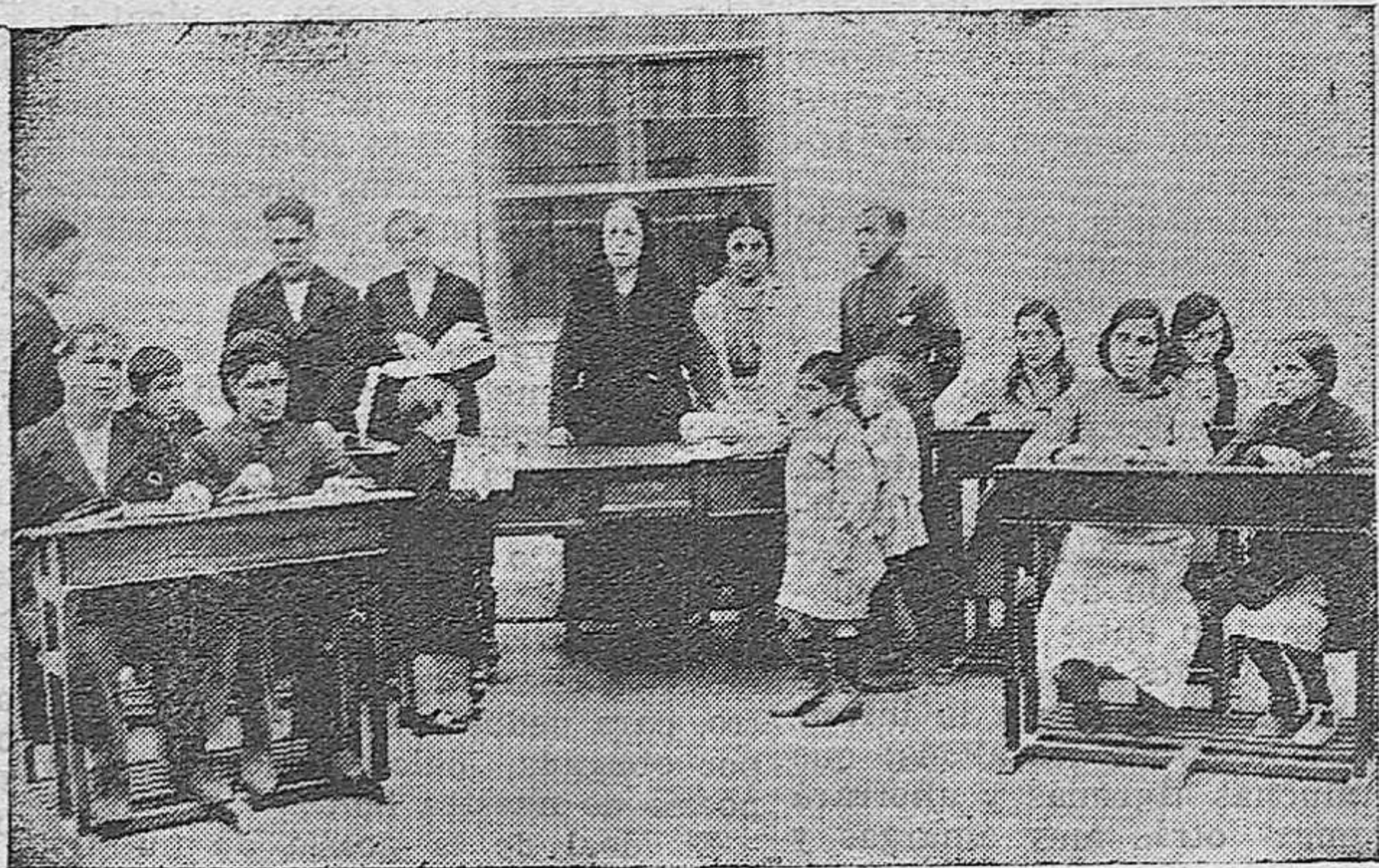
En la clase de ciegos, la profesora va explicando la lección...

En un mapa en relieve que representaba España, les invité a señalar la situación de las distintas ca-