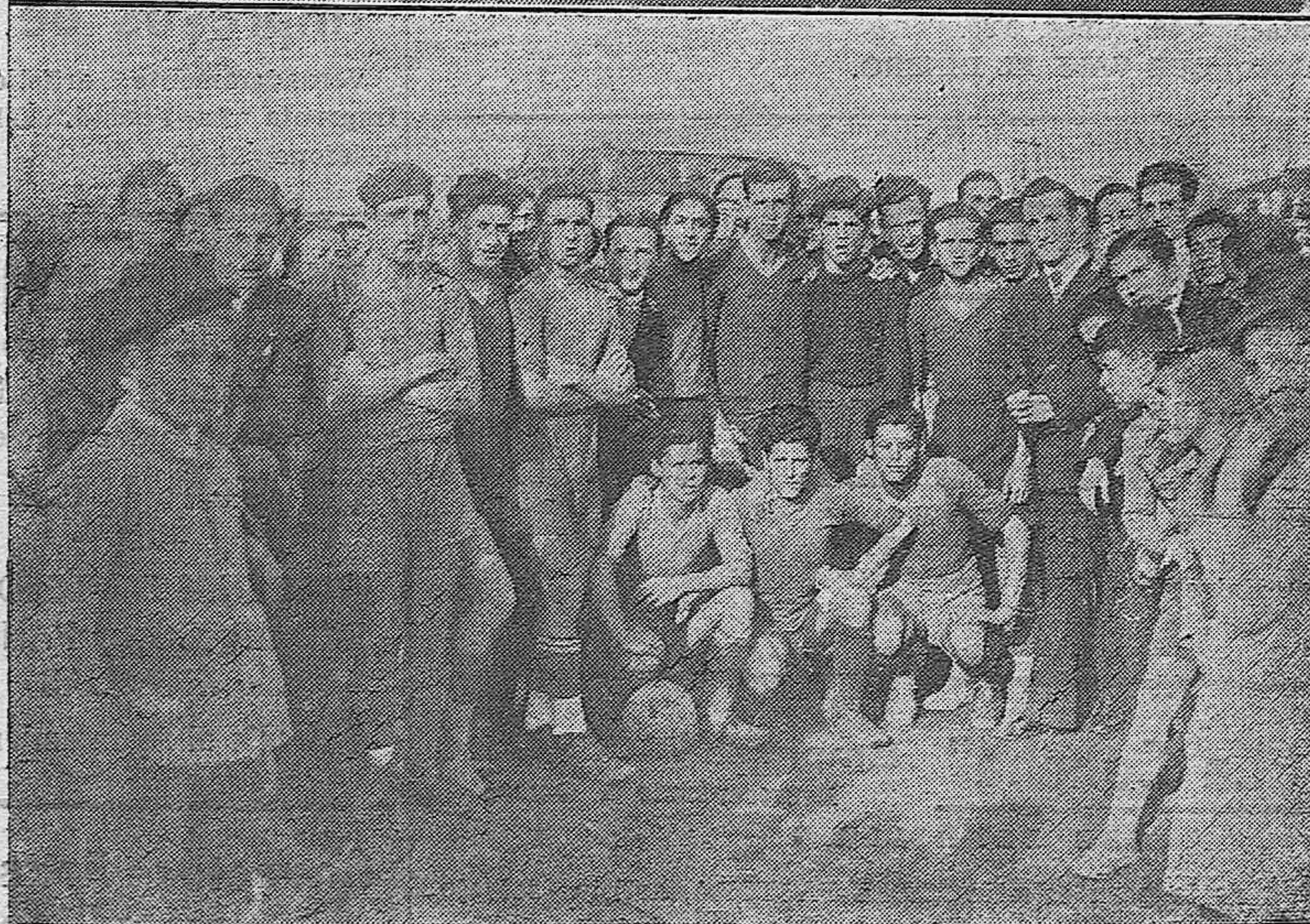
En el Stadium América los equipos Once Rojo y el Racing Club de Córdoba, jugaron ayer un partido amistoso para recaudar fondos con motivo del desplazamiento del Racing Club a Madrid para jugar el eliminatorio. Venció el segundo por tres a dos.