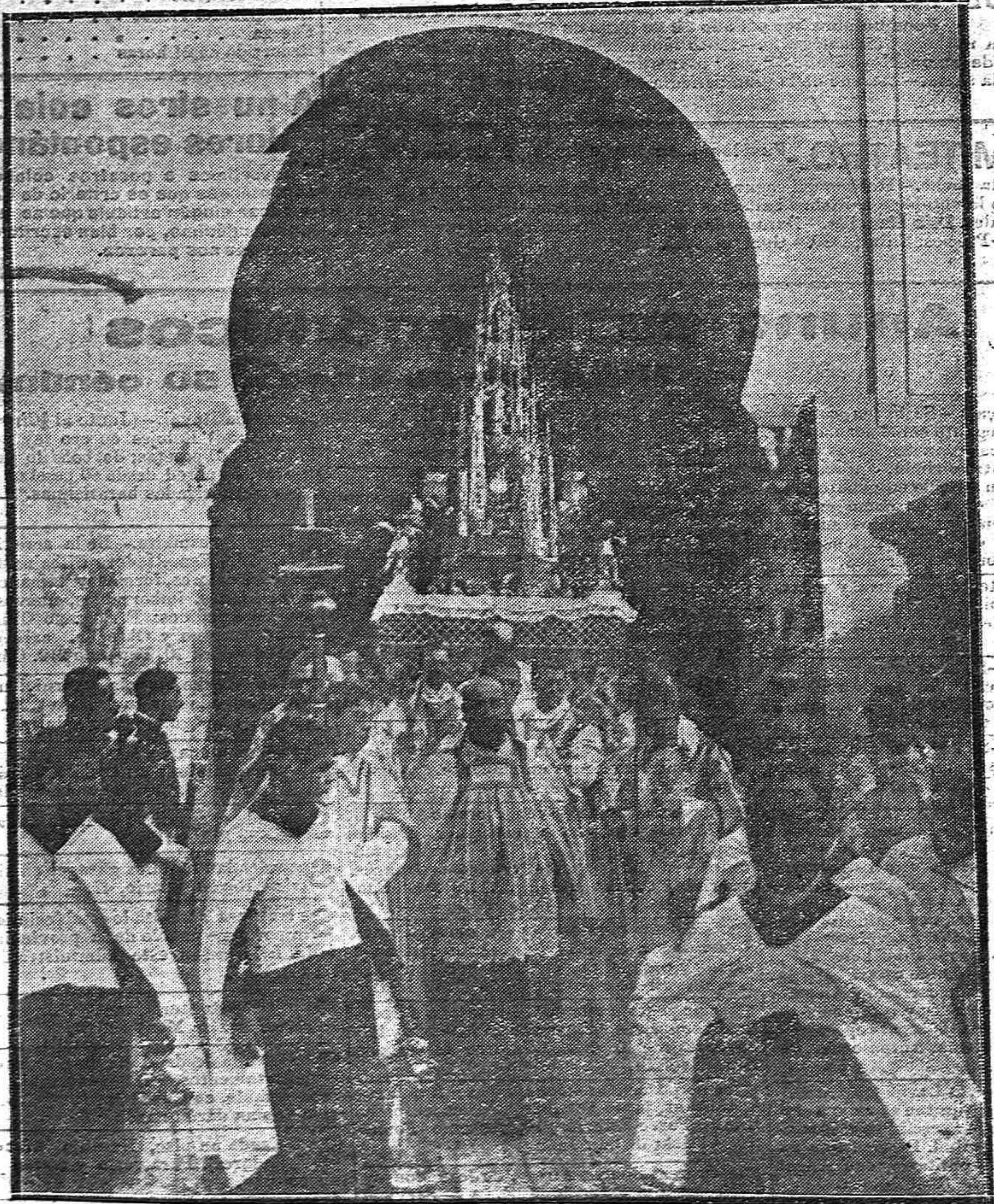
LA OCTAVA DEL CORPUS.--La Custodia de Arfe al ser sacada ayer procesionalmente por los alrededores de la Catedral.