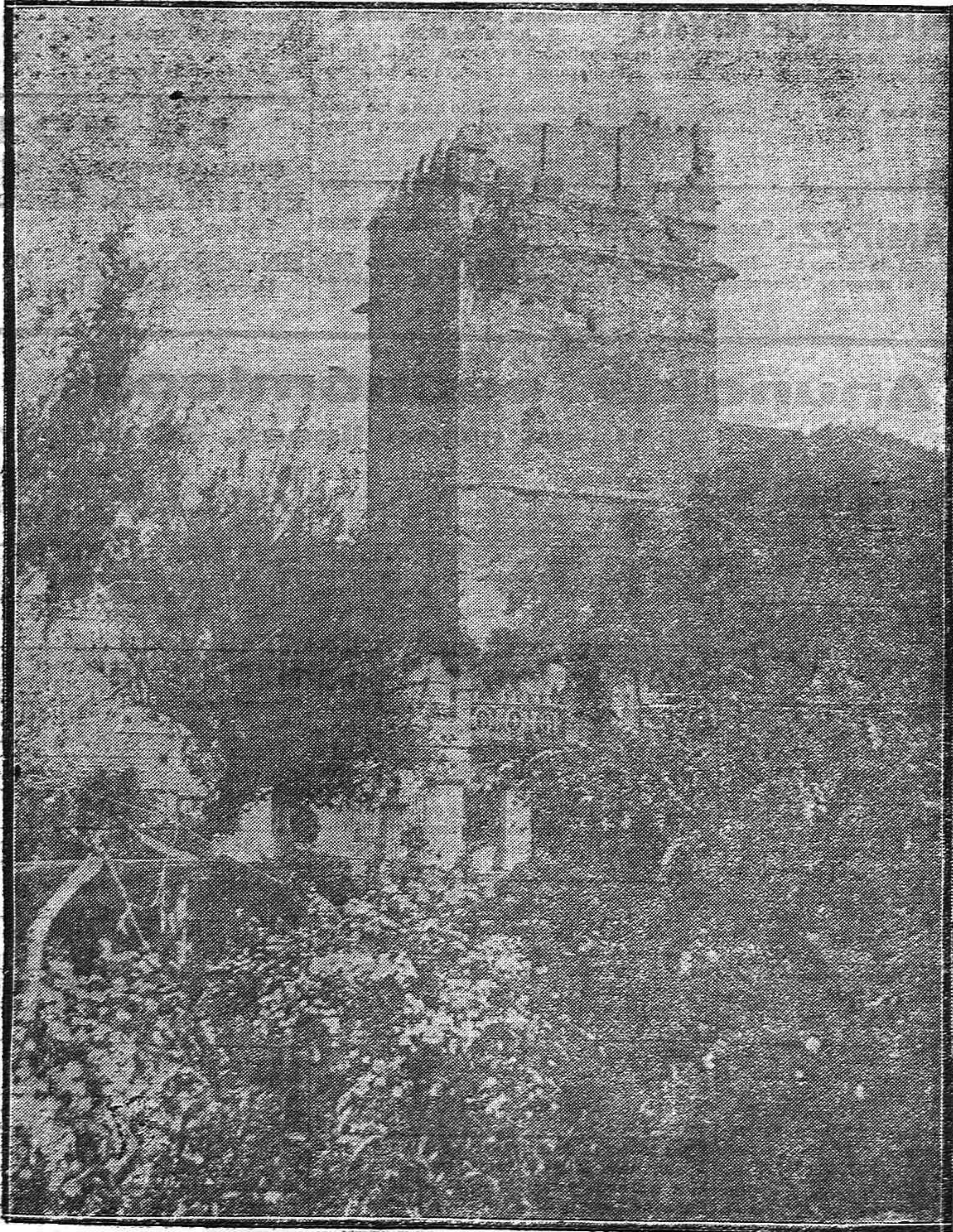
FOTOGRAFIA ARTISTICA.--Bello rincón del jardín de la Huerta del Alcázar, primer premio en el concurso organizado por la Real Sociedad de Arqueología y Excursiones.