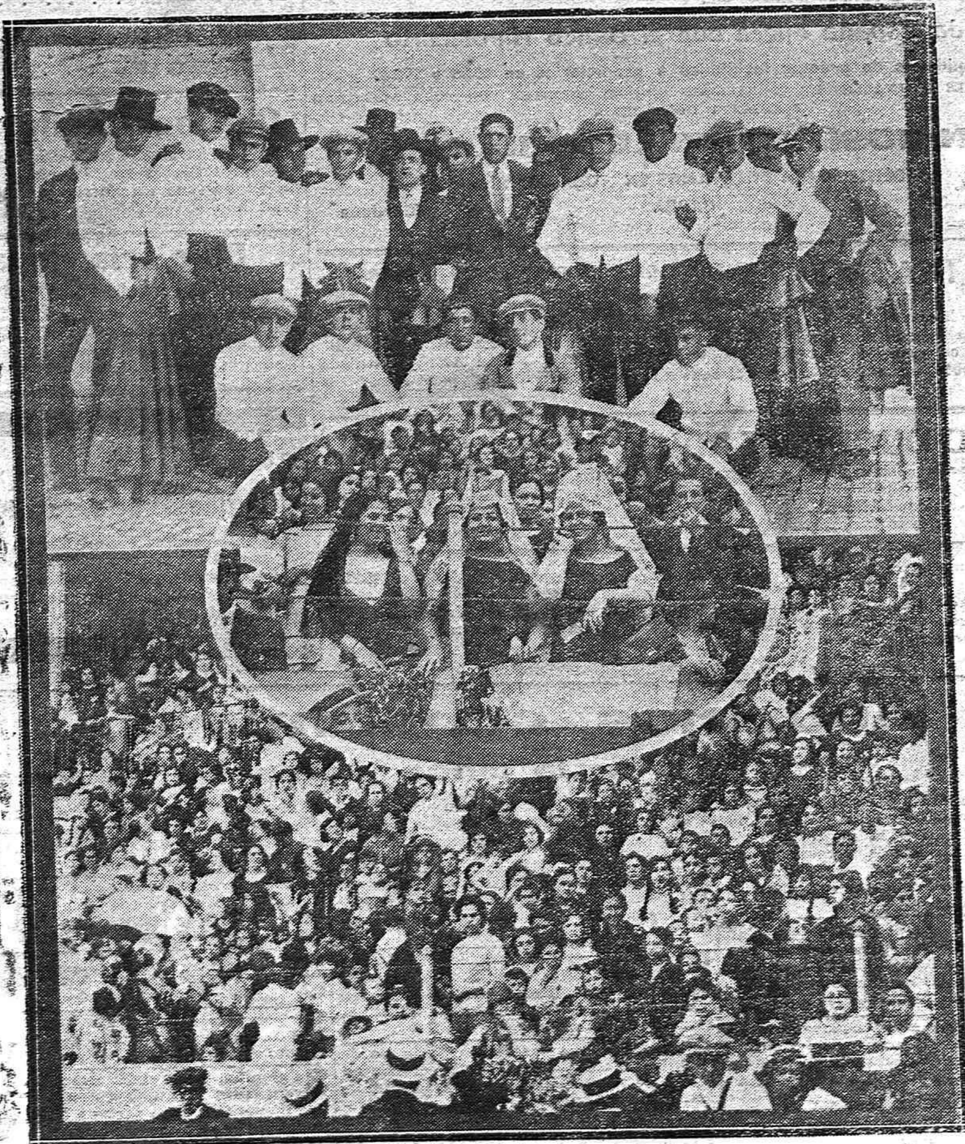
LA BECERRADA DEL CLUB GUERRITA.--1) Las cuadrillas antes de efectuar el paseo.-2) Aspecto de uno de los tendidos de la plaza.-(En óvalo) Detalle de una barrera.