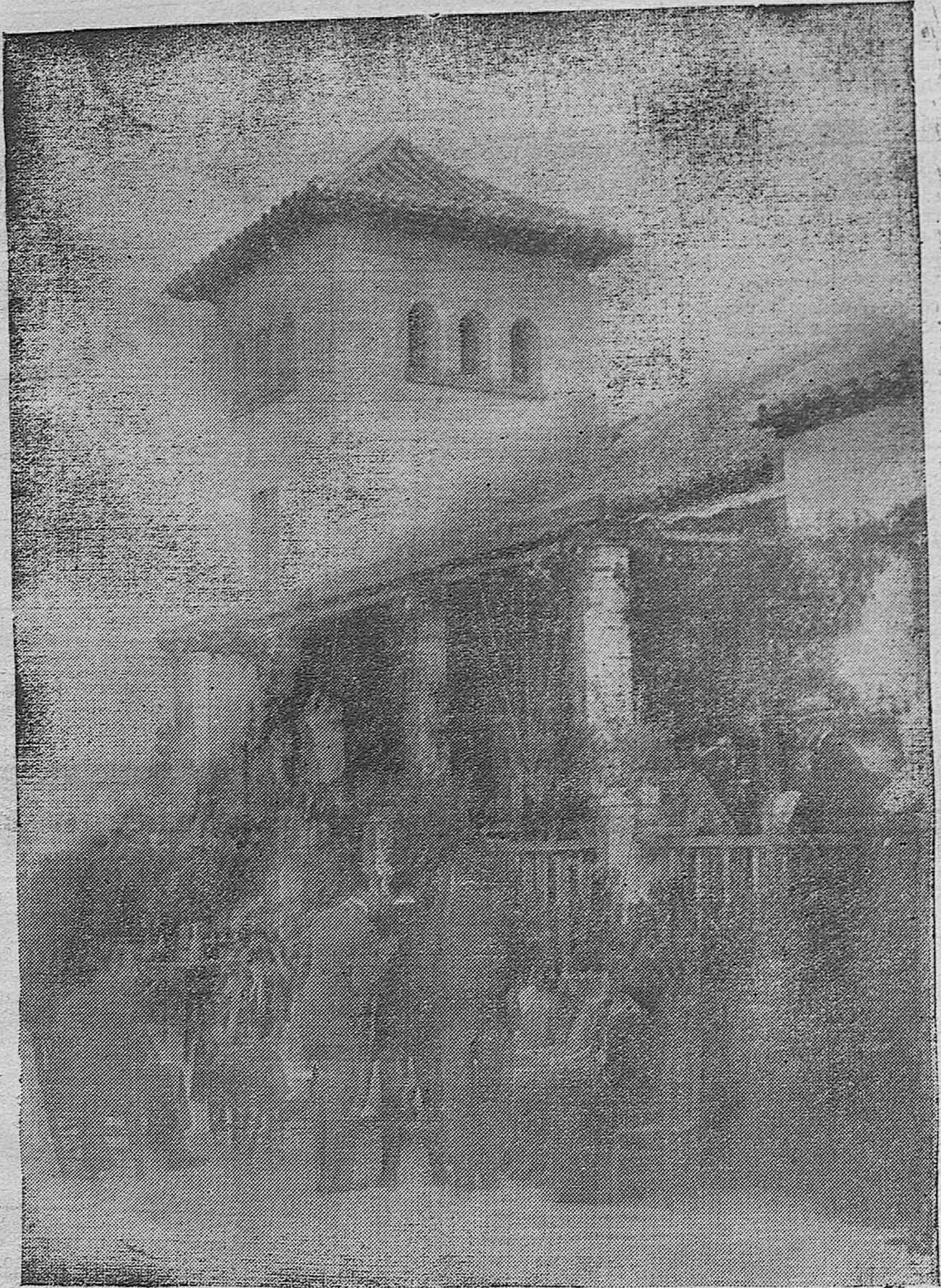
ASPECTO DEL CHALET DE LA REAL SOCIEDAD DE TIRO DE PICHÓN DE CÓRDOBA, EN LAS TIRADAS DE AVER.