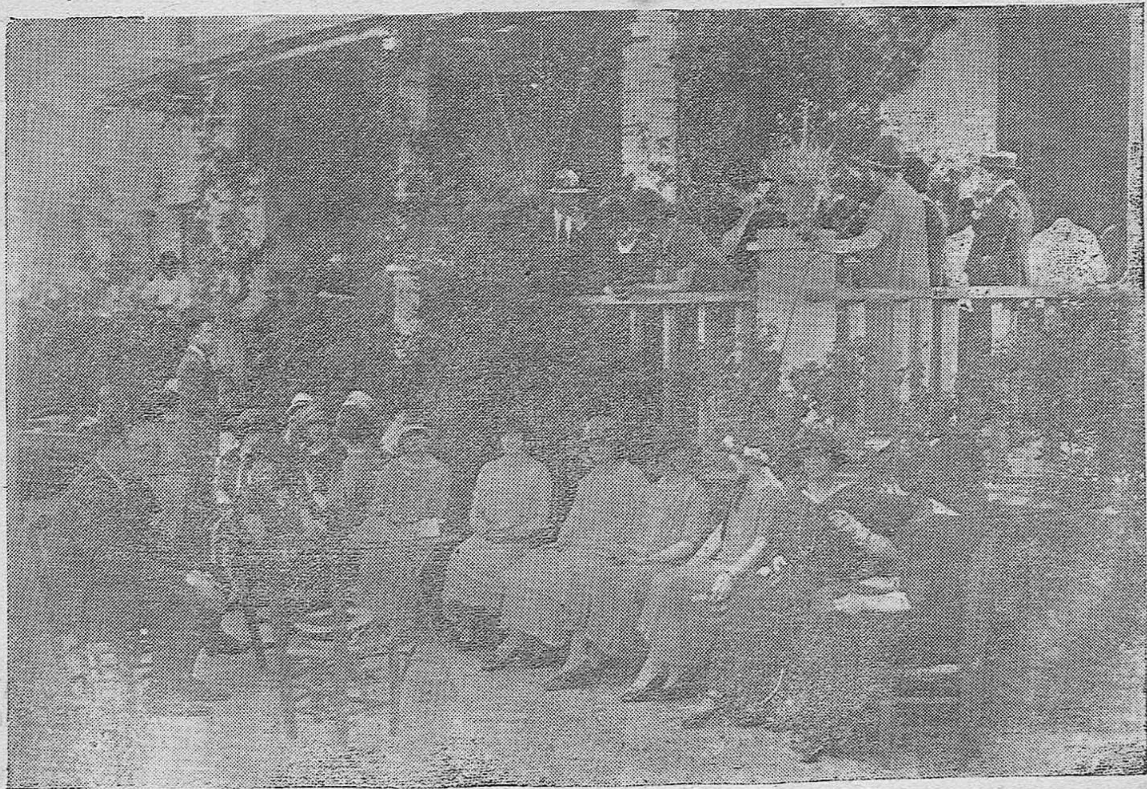
EN EL TIRO DE PICHÓN.—UN GRUPO DE ARISTOCRÁTICAS SEÑORITAS PRESENCIANDO LAS TIRADAS.