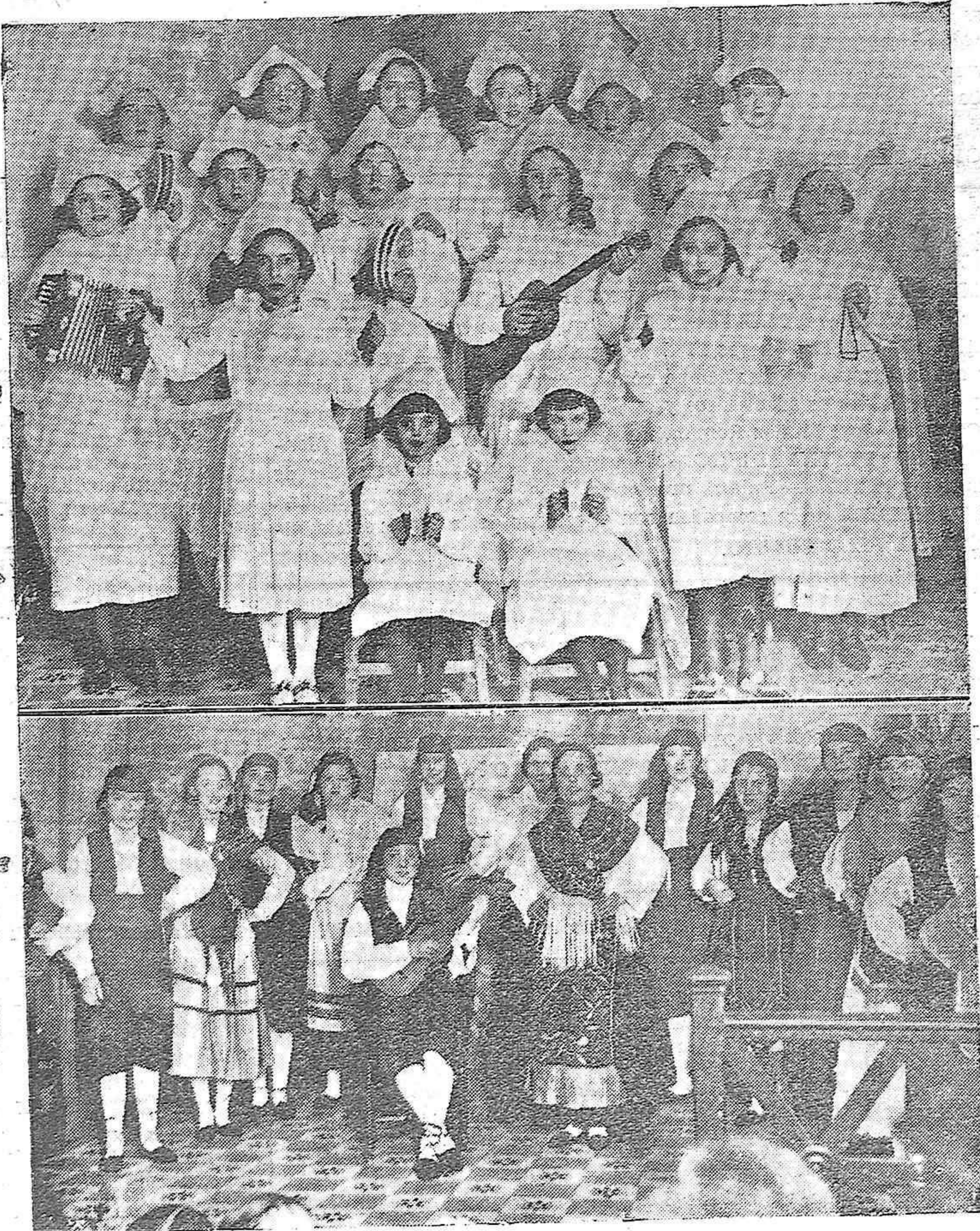
En el Colegio de la Piedad se ha celebrado un festival teatral-literario. En él intervinieron bellas muchachas. Al final se hizo una colecta entre las personas que asistieron para adquirir ropas que han de repartirse a los pobres, en las próximas fiestas de Navidad.