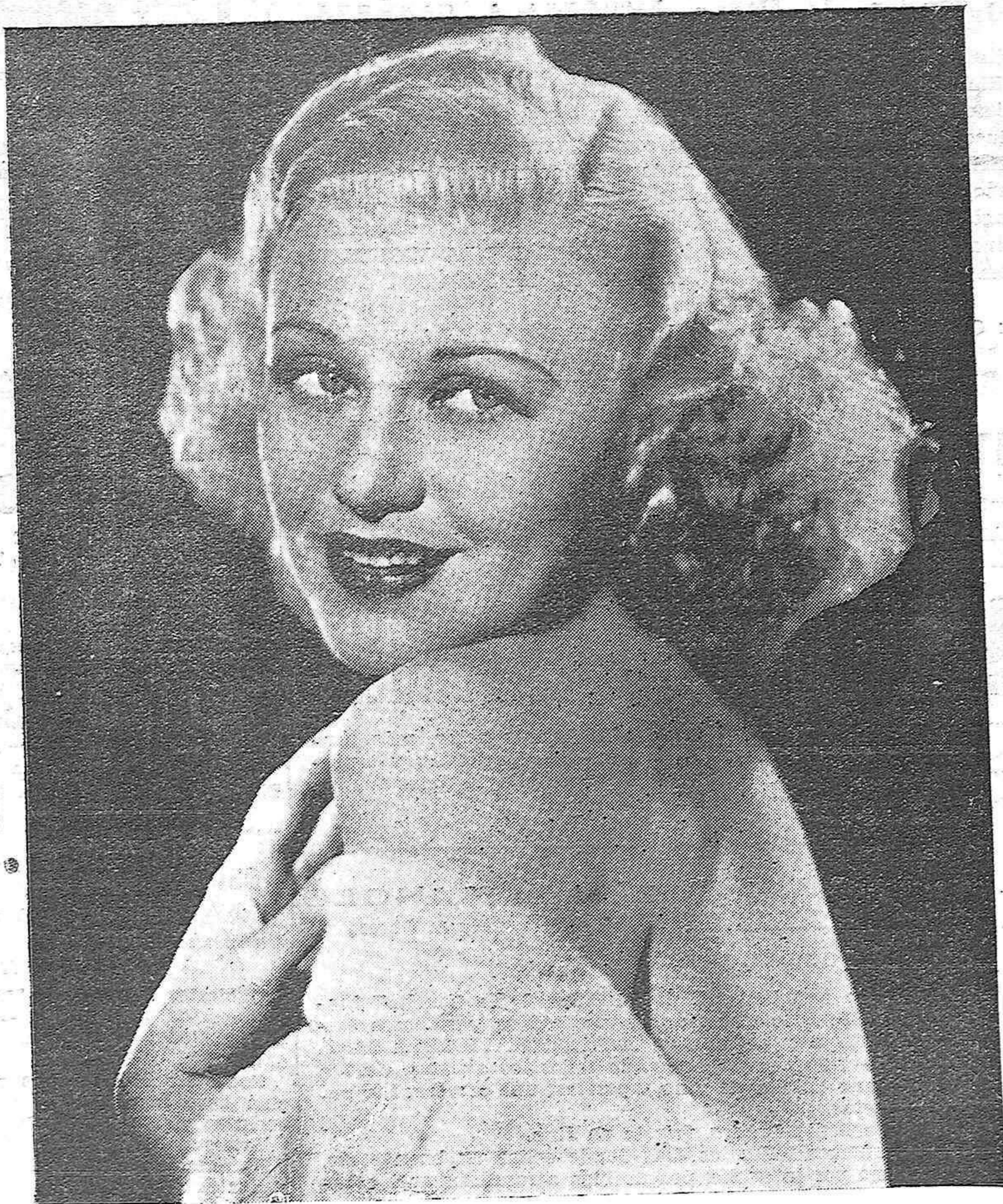
La bellissima Grougiers Roger, protagonista del film Radio "La alegre divorciada".