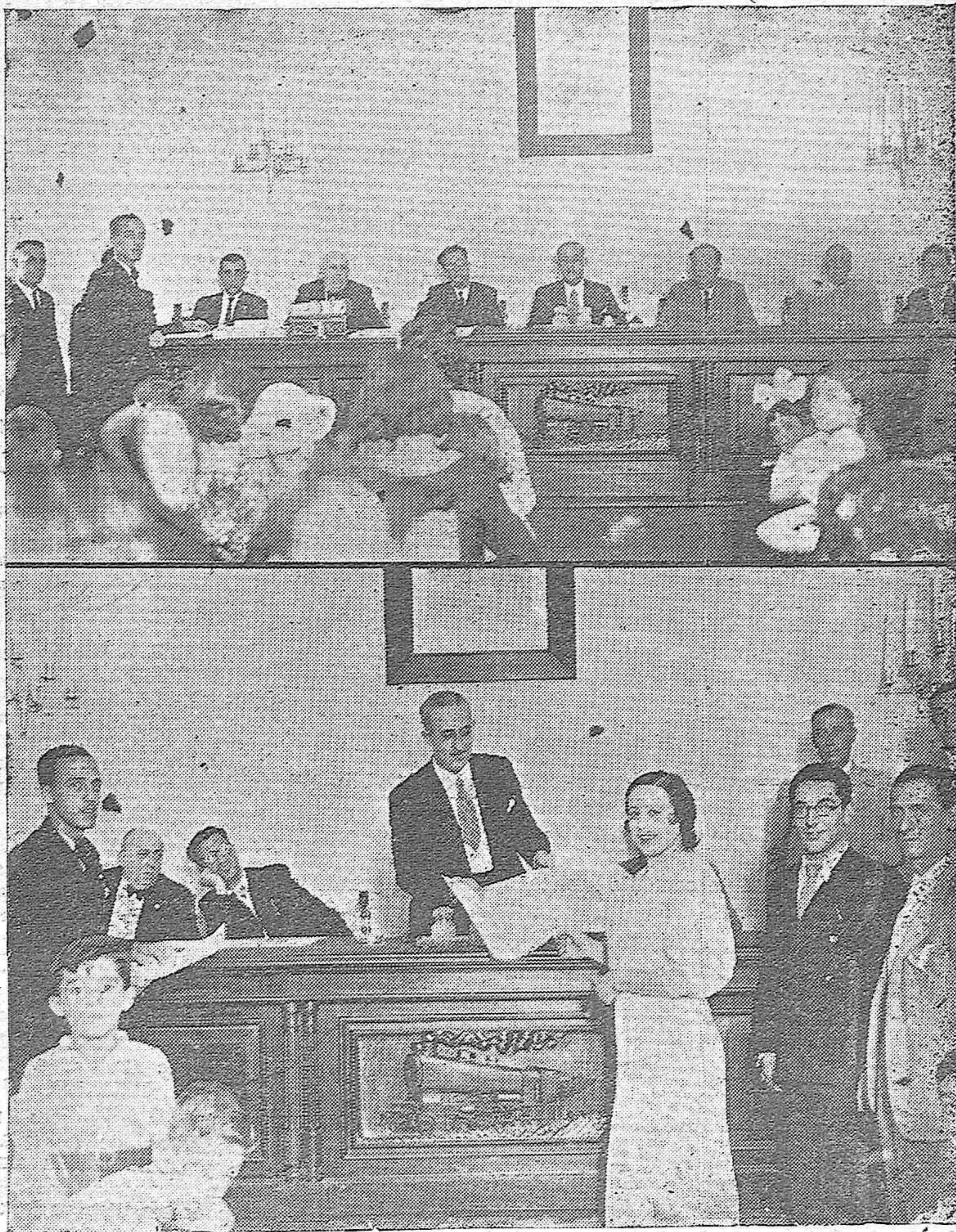
Entrega de premios y Diplomas en la Escuela Ferroviarias de la 21 Zona, asistiendo las autoridades y distinguidas personalidades