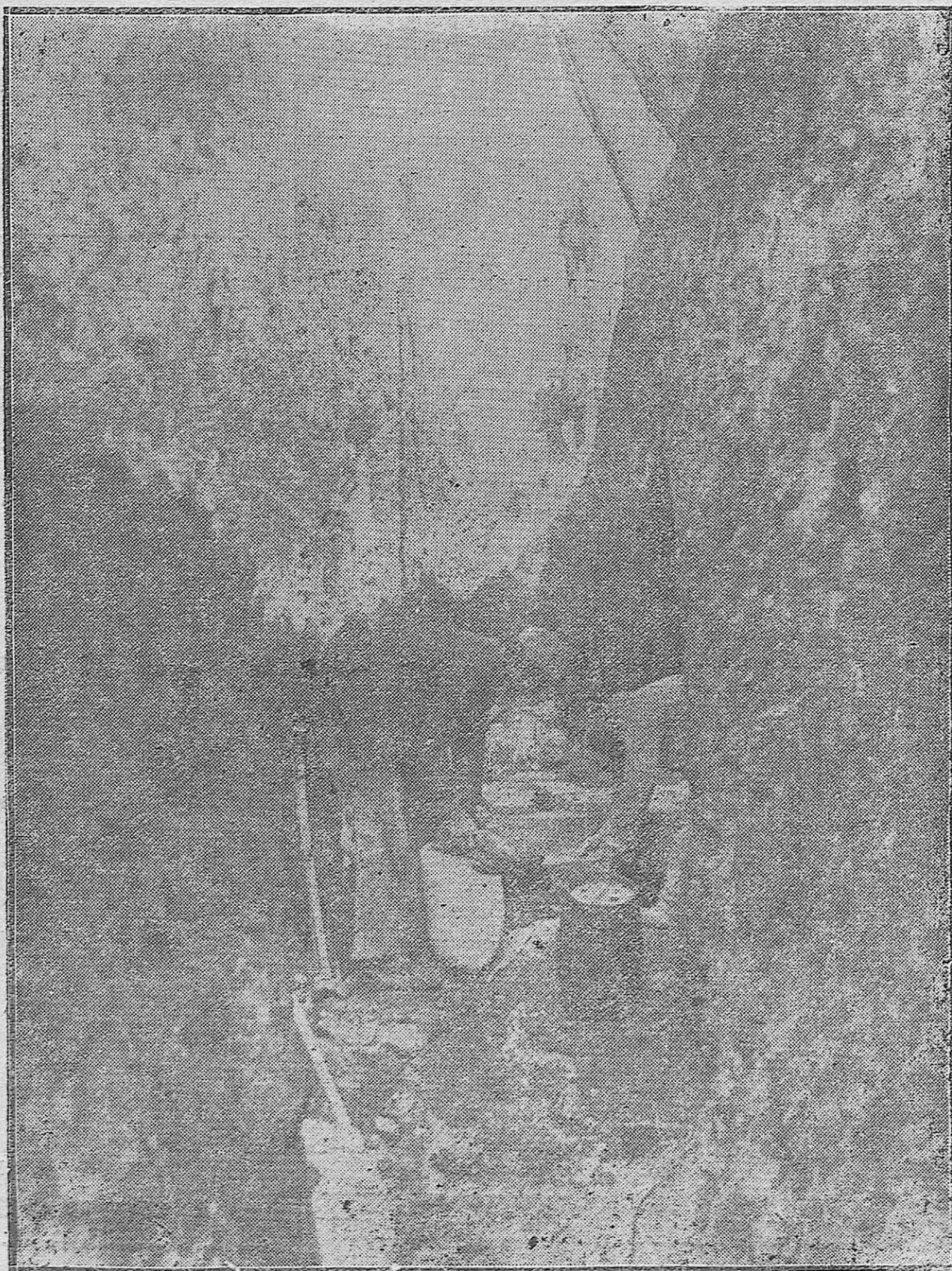
HALLAZGO ARQUEOLOGICO.--Lugar de la alcantarilla en construcción del Gran Cap ha sido encontrado un precioso mosaico romano.