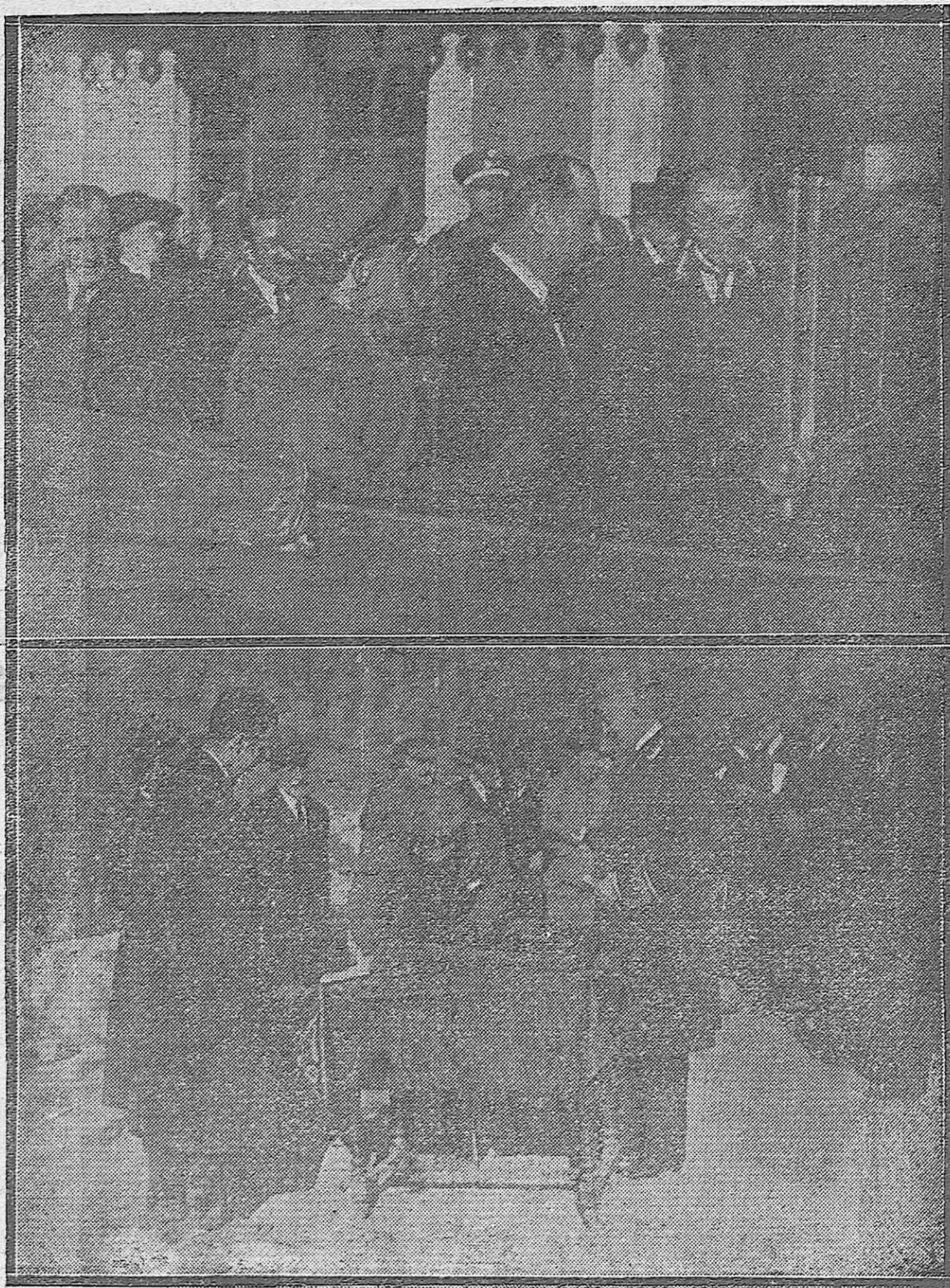
1) Don Alfonso XIII al subir al automóvil acompañado del alcalde de la ciudad señor Cruz Conde a su llegada a Córdoba.—2) Su Majestad el Rey firmando el pergamino que recordará su visita a las obras del pantano del Guadalmellato.