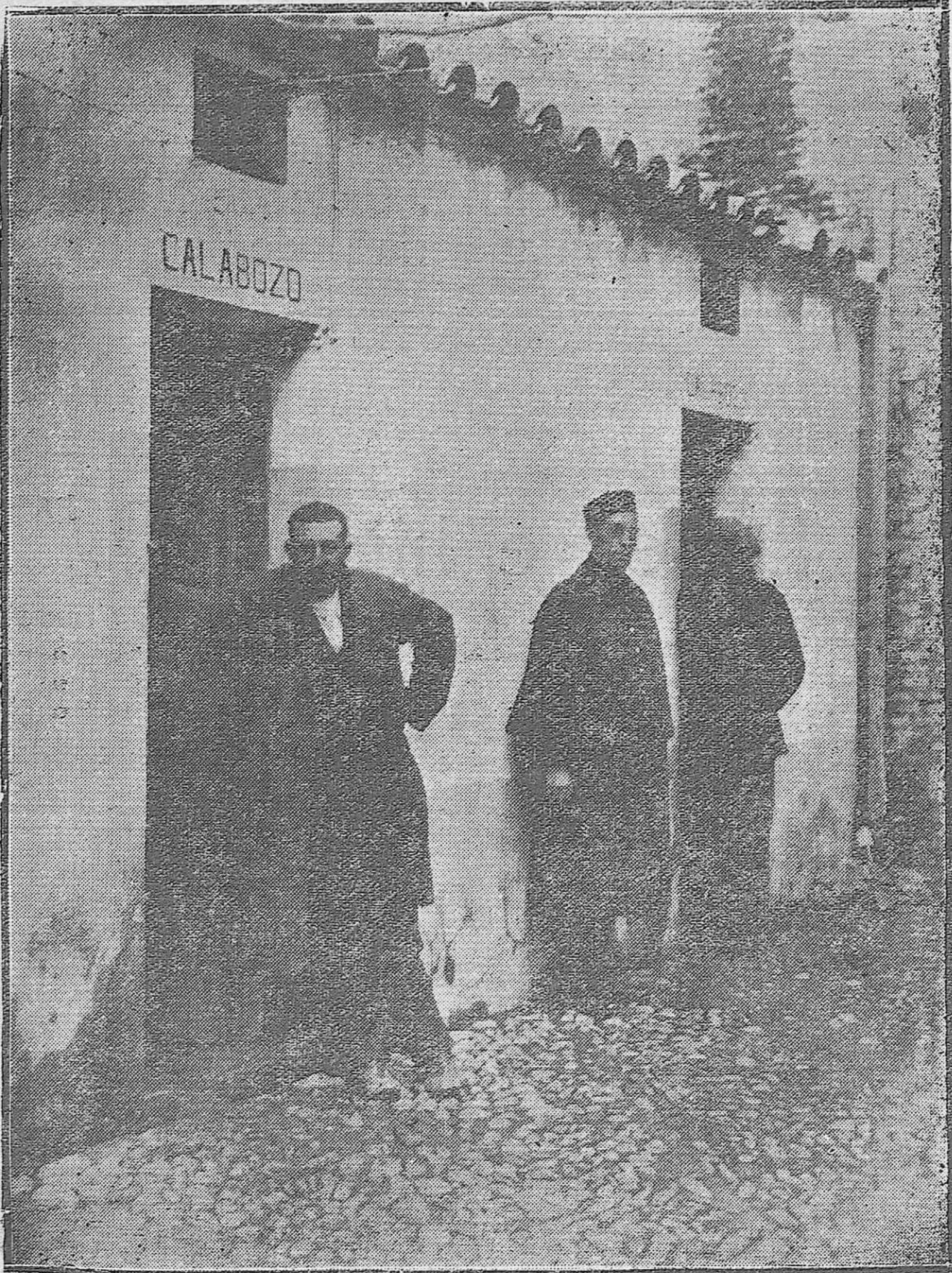
Los calabozos de la Comisaría de Vigilancia, cuya decorosa reforma se hace inaplazable.