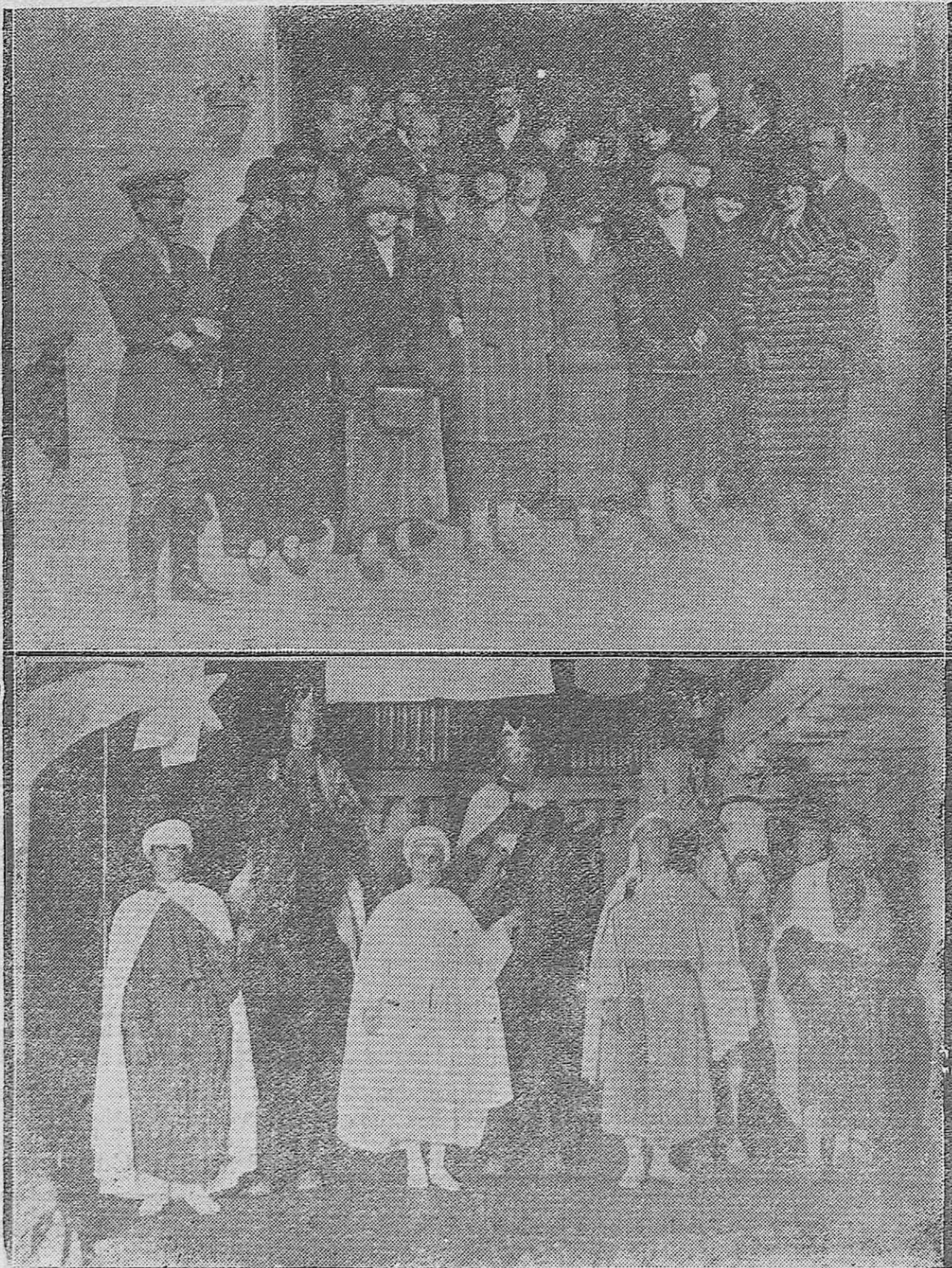
1) El alcalde, concejales, diputados y damas, visitantes del soldado, que repartieron el aguinaldo en el Hospital Militar.—2) Los Reyes Magos en el patio de la típica posada del Petro, de donde salieron.