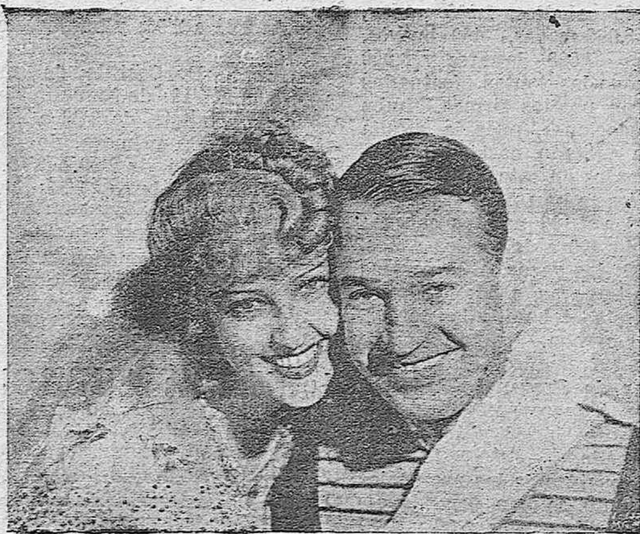
Jeanette Mac Donald y Chevalier, en su gran creación “La viuda alegre”, film M. G. M.

La filmación de “Morena Clara” va a ser llevada rápidamente, y, según noticias, están ya casi ultimados los escenarios en que se ha de tomar la obra.