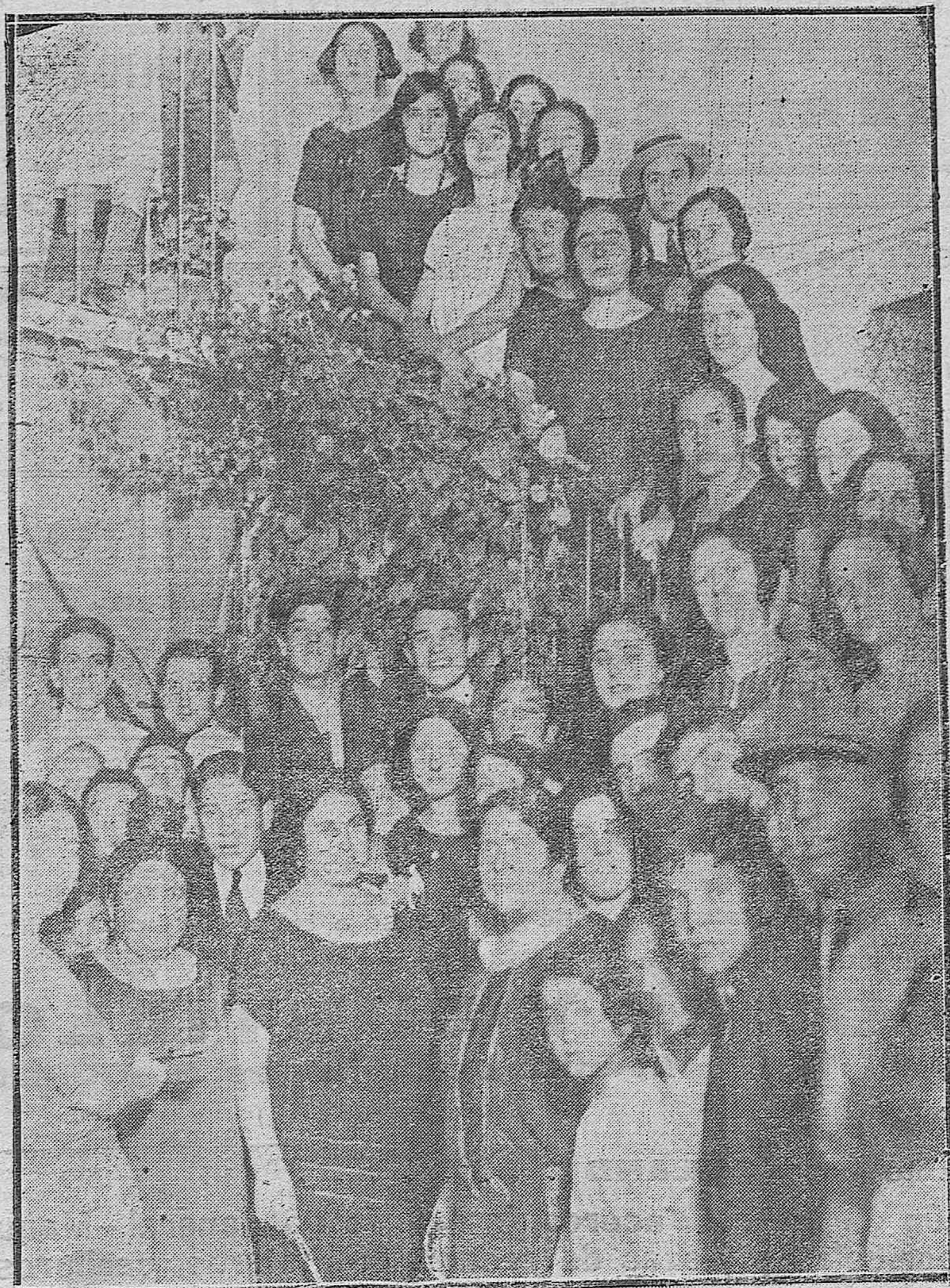
UN BATEO CLÁSICO.—CONCURRENTES AL BAPTISMO CELEBRADO ANOCHÉ EN LA CASA NÚM. 1 DE LA CALLE DEL CAÑO.