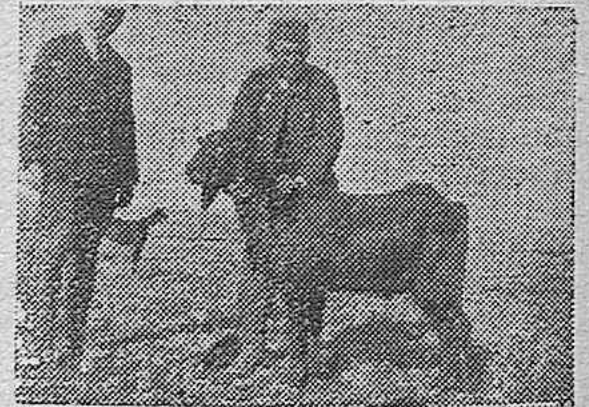
CHIVO NEGRO, UN AÑO, RAZA GRANADINA.

Ya decimos que los síntomas son variados, y consisten esencialmente en un proceso febril (calentura), que dura varios días, y una vez que transcurre el período agudo, aparecen las localizaciones, bien en las mamas (mamitis, ubrero), bien en las articulaciones (cojeras artíticas), o ya en los ojos (lagrimeo, enturbiamiento, ulceración de la córnea, ceguera).