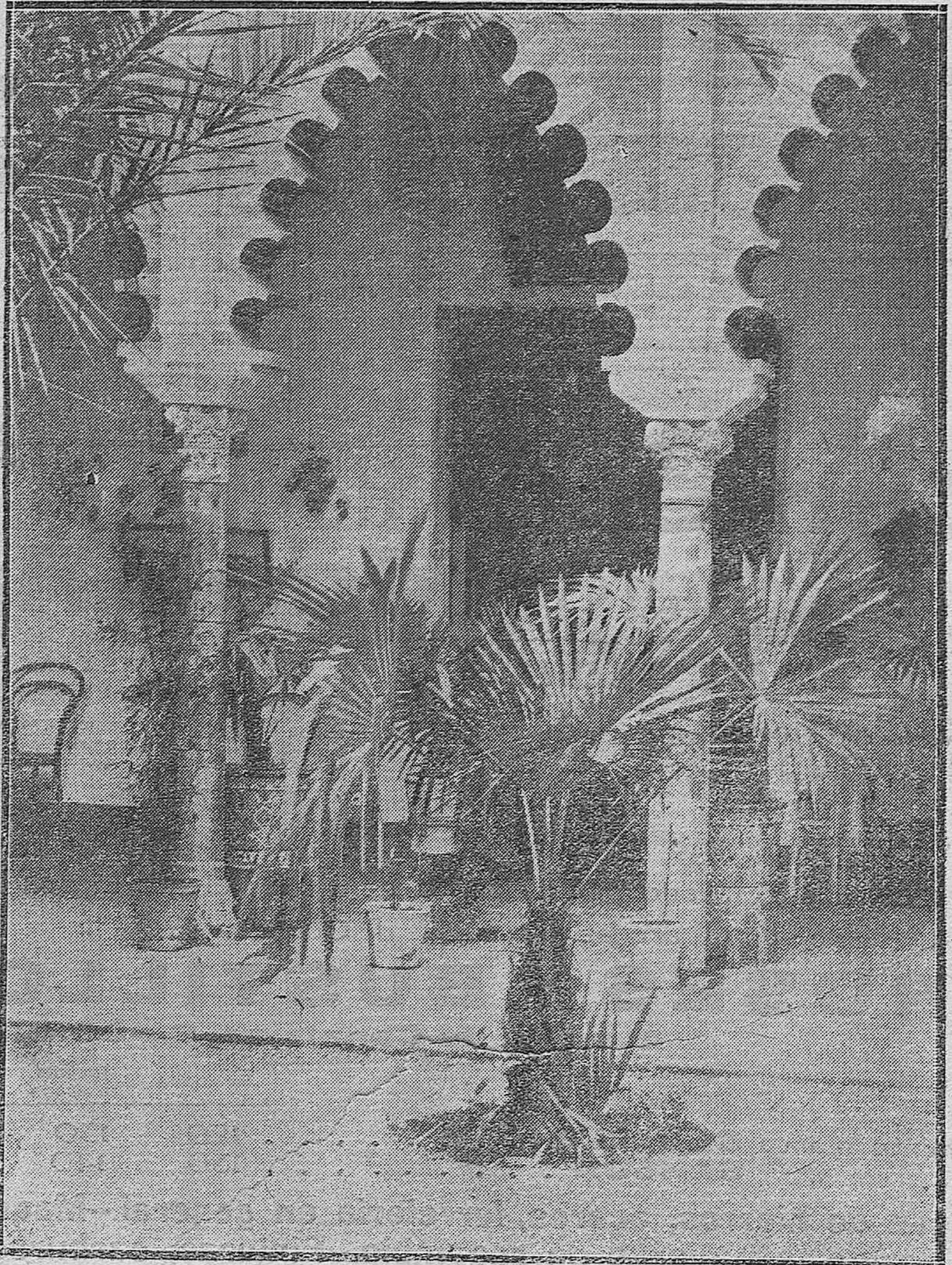
PATIOS CORDOBESES.—DETALLE DE UNO DE LA CALLE DE MANRIQUEZ.