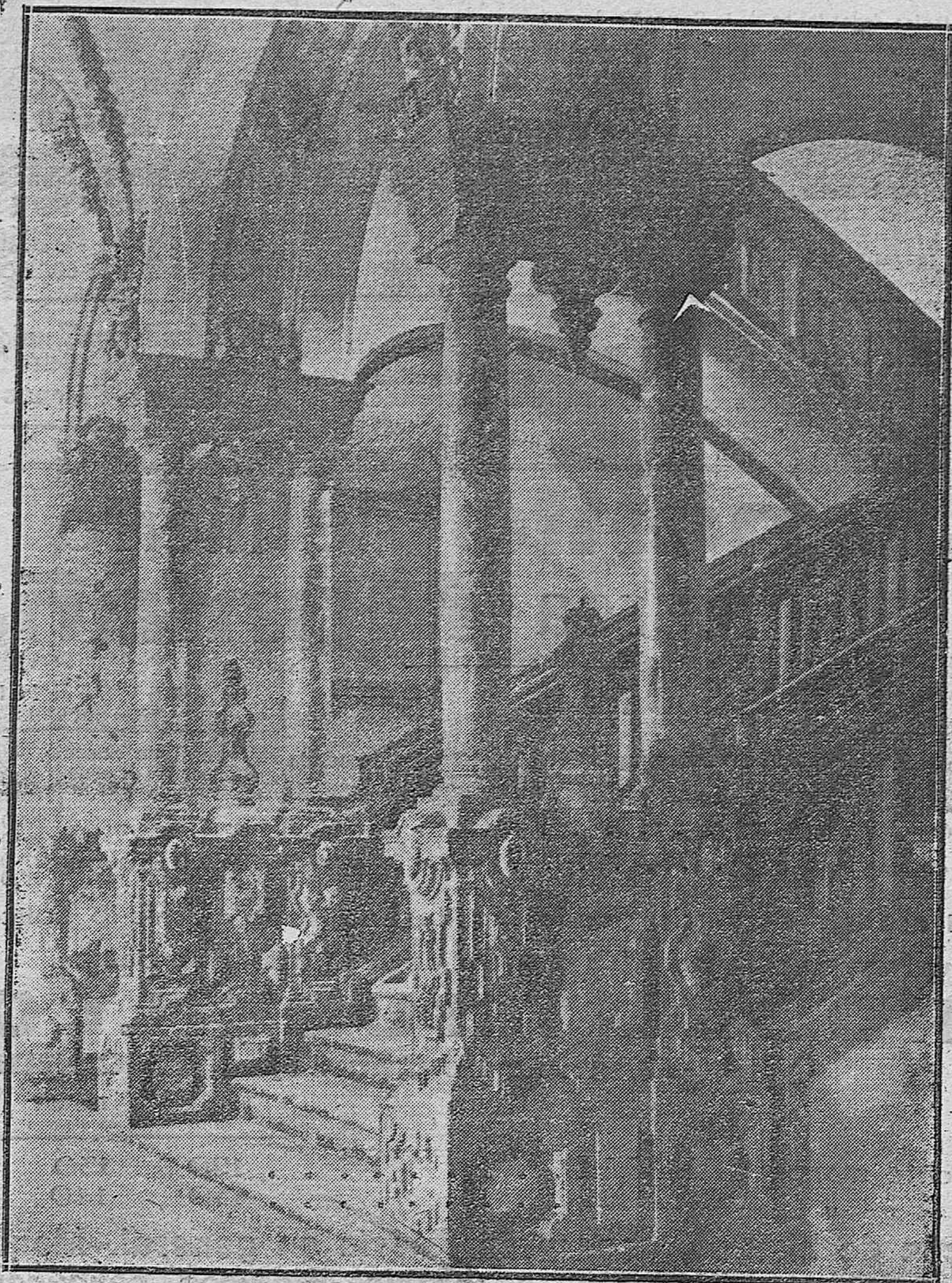
CÓRDOBA ARTÍSTICA Y MONUMENTAL.—DETALLE DE LA ESCALERA DE LAS ESCUELAS PÍAS DE LA COMPAÑÍA, DEL MÁS PURO ESTILO BARROCO.