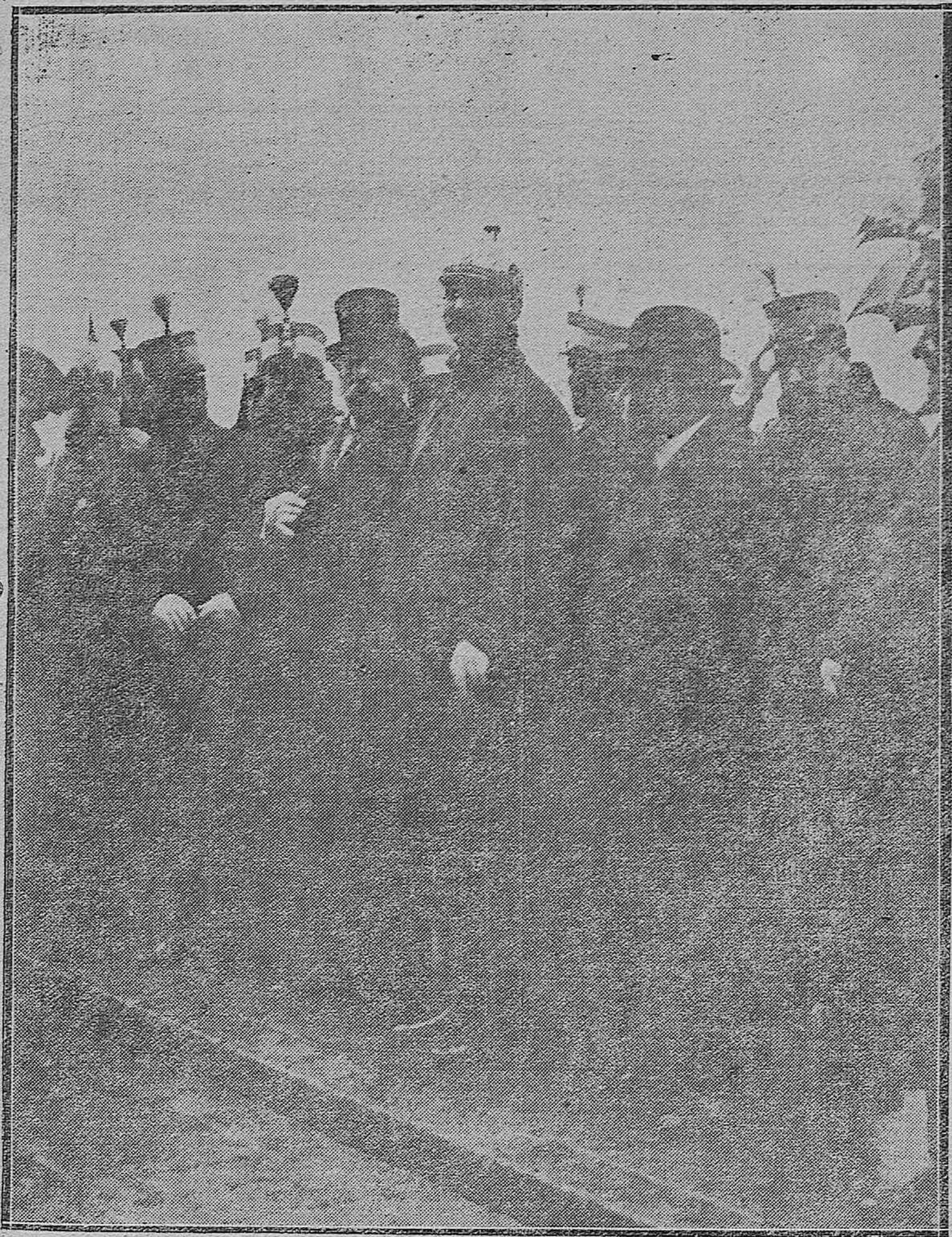
LA PATRONA DE LA INFANTERIA.—El gobernador militar con las demás autoridades, presenciando el desfile de la fuerza que asistió a la Misa en la Compañía.