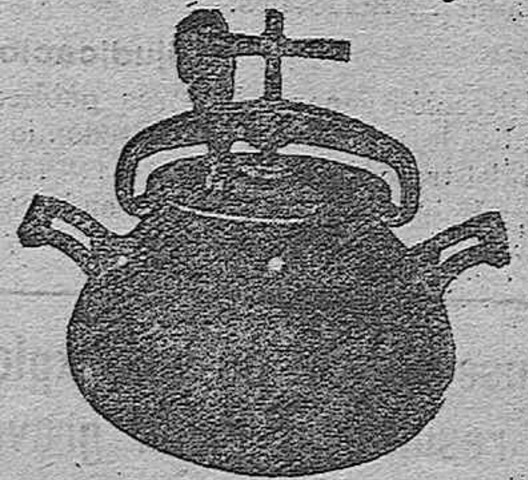
Marmita Hispano-Olla Exprés

Batería de cocina - Herrajes para obras y herramientas en general