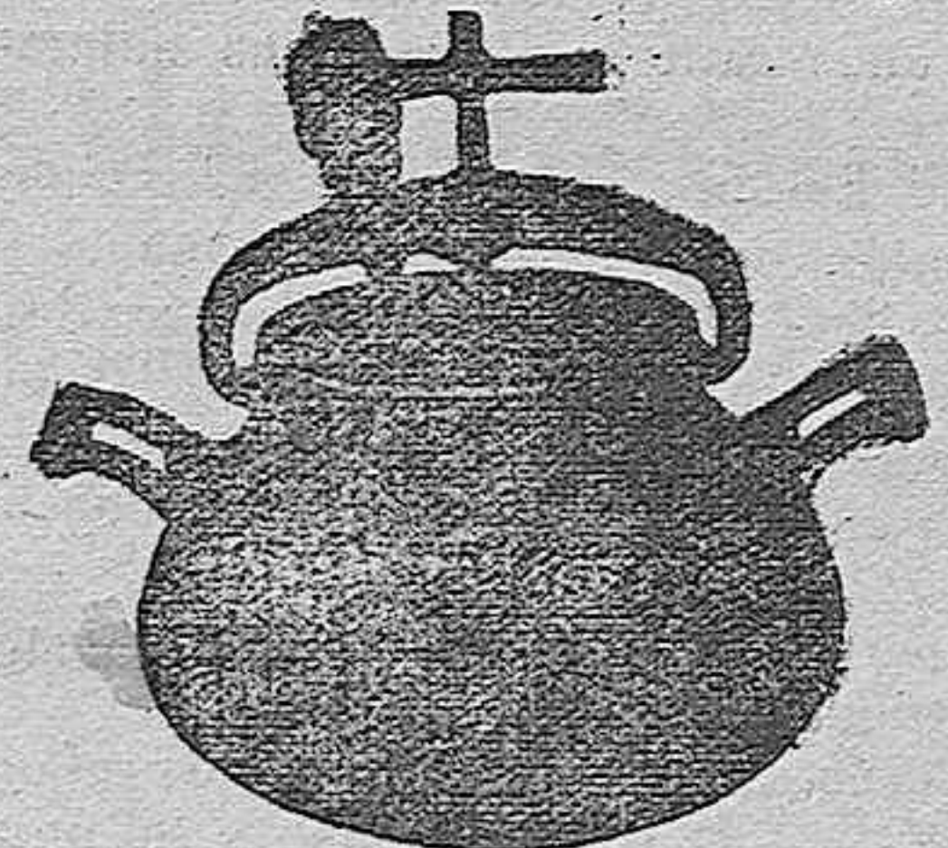
Marmita Hispano-Olla Expres

Batería de cocina - Herrajes para obras y herramientas en general