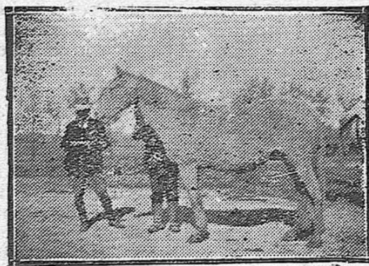
HÉRMOSO EJEMPLAR DE RAZA CABALLAR ANDALUZA.

—Las gallinas necesitan casi todo el año su ración de verde. Si se vé que no la consumen rápidamente, se cortan las yerbas u hortalizas en pequeños trozos, sirviéndoselas en comederos.