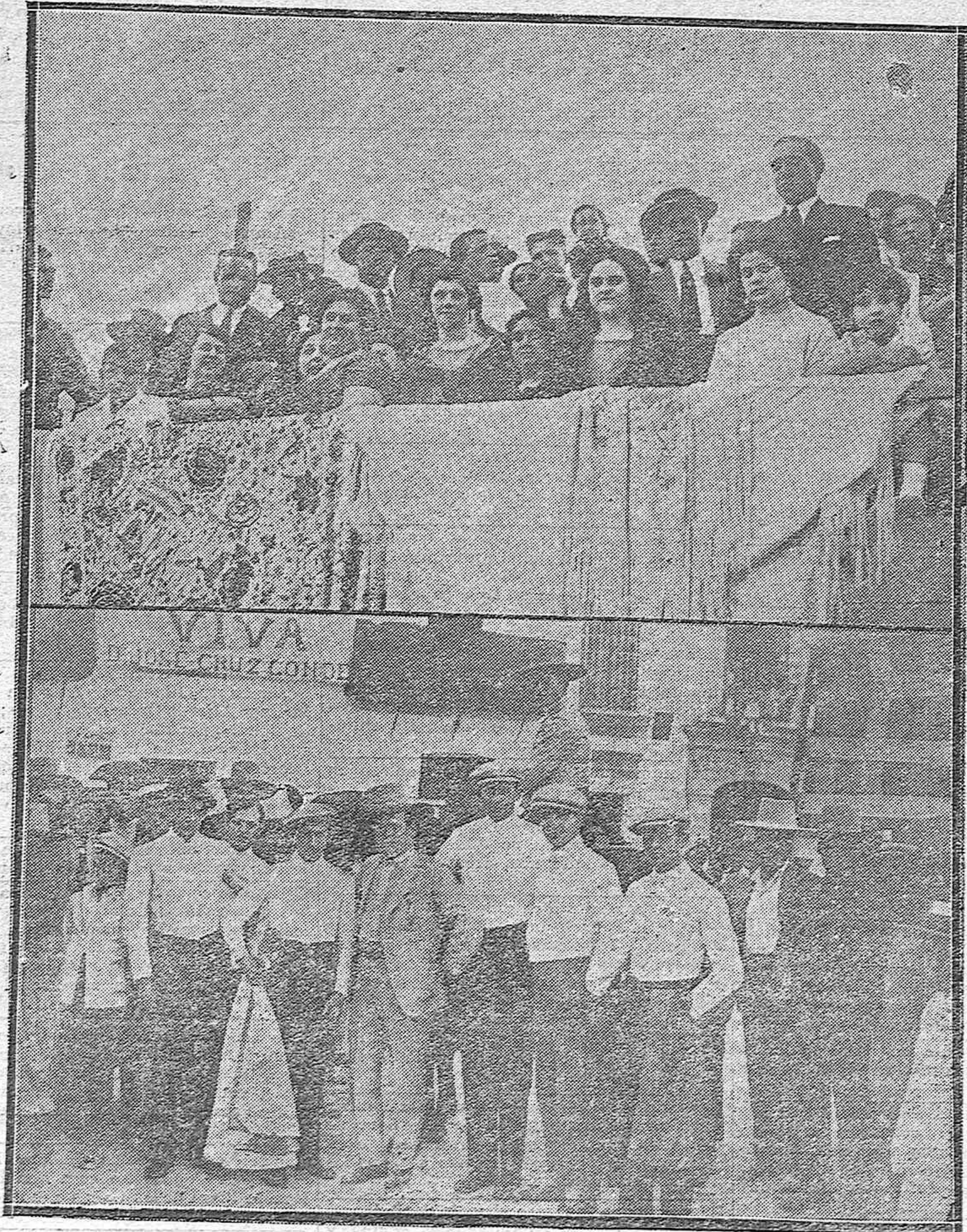
NOTAS GRÁFICAS DE LA FERIA DE ESPEJO.-Aspecto de un palco en la corrida última.-Los «foreades» antes de hacer el paseo.