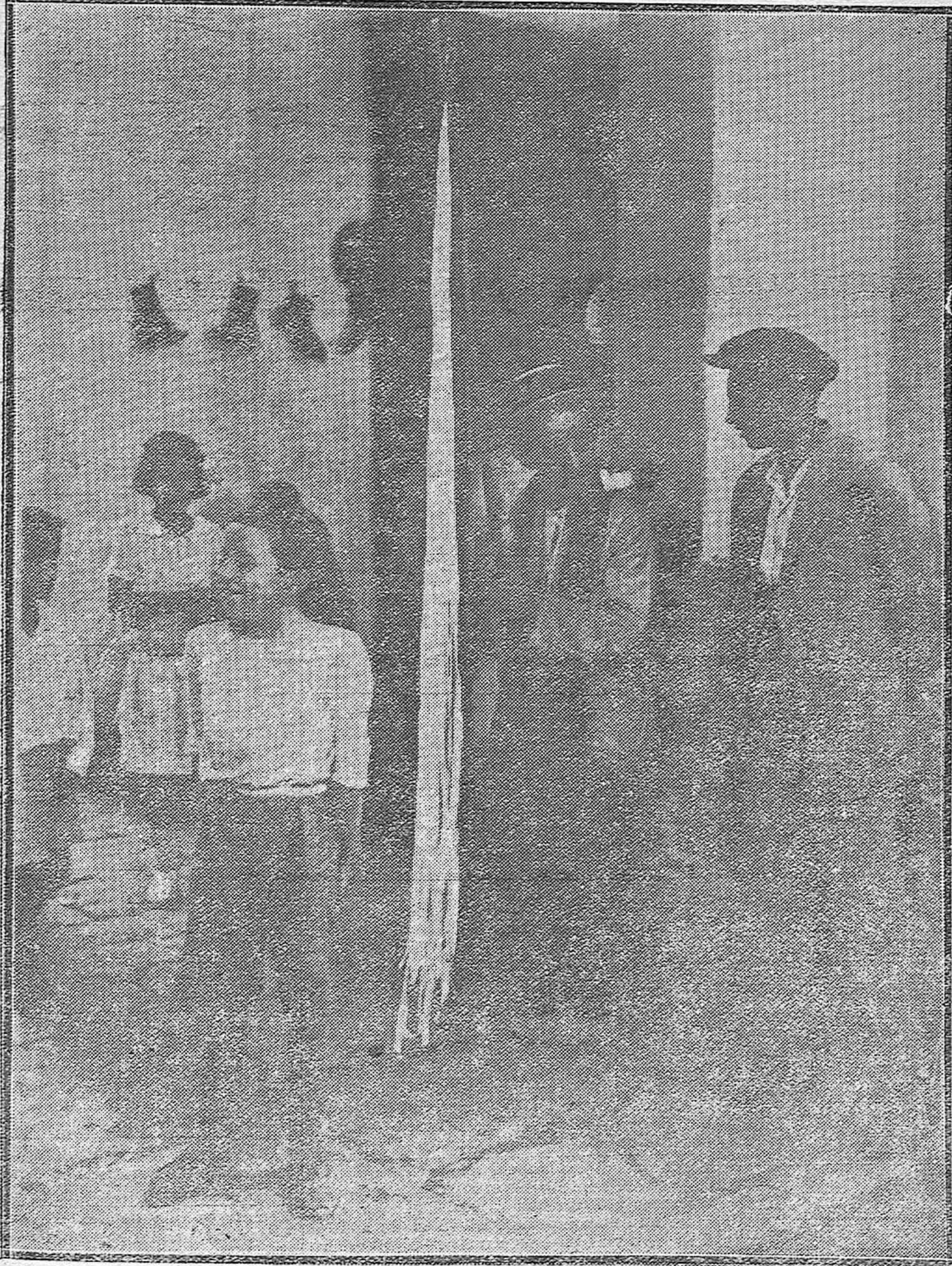
TIPOS POPULARES CORDOBESES.--El conocidísimo "Tío Miseria" que de manera tan original expone su mercancía a las mocitas que pasan por la calleja del Toril a las horas de mercado.