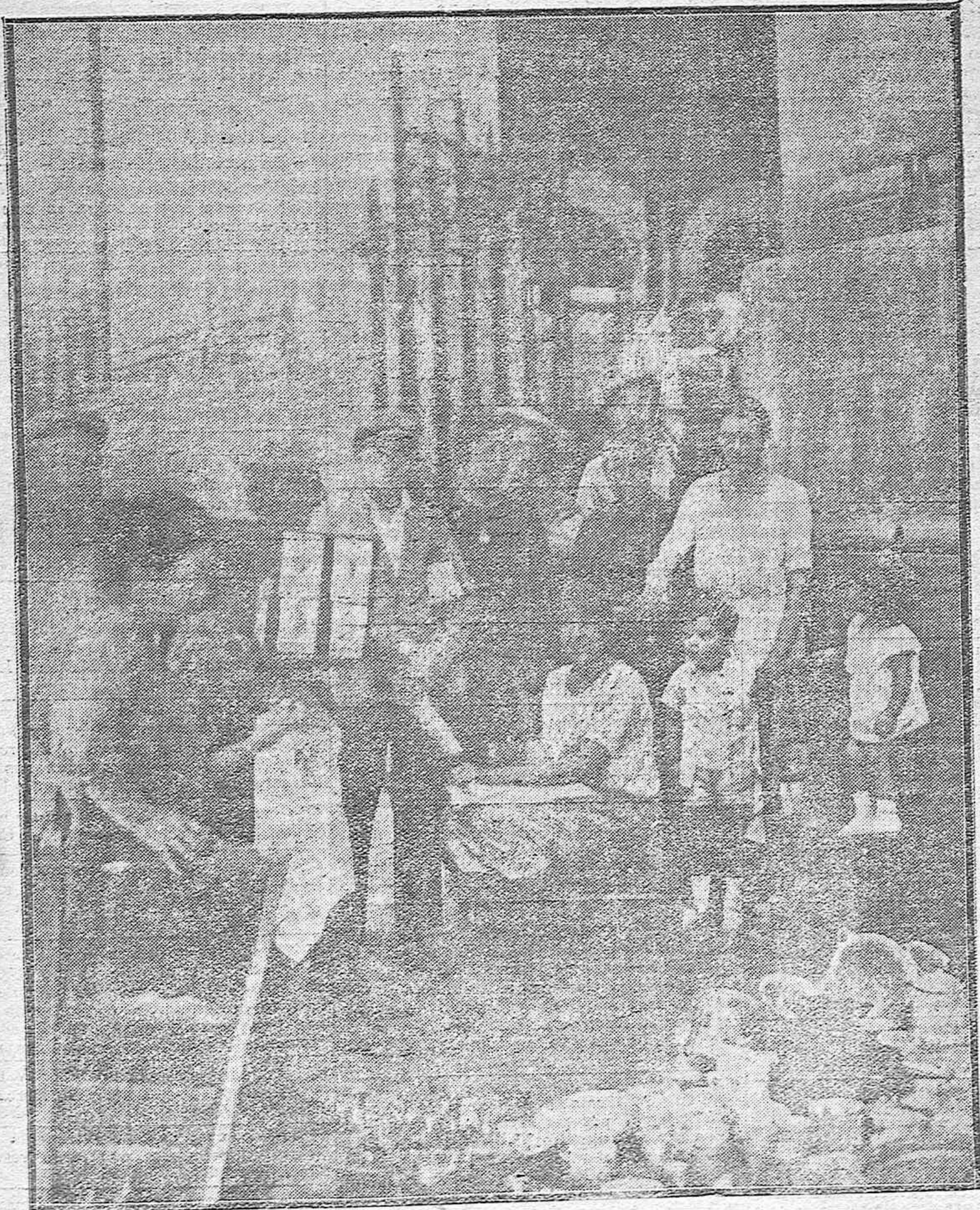
ESCENAS GRÁFICAS CORDOBESAS.--Un fotógrafo de "al minuto" ejerciendo su simplificado arte en la plaza de la Corredera.