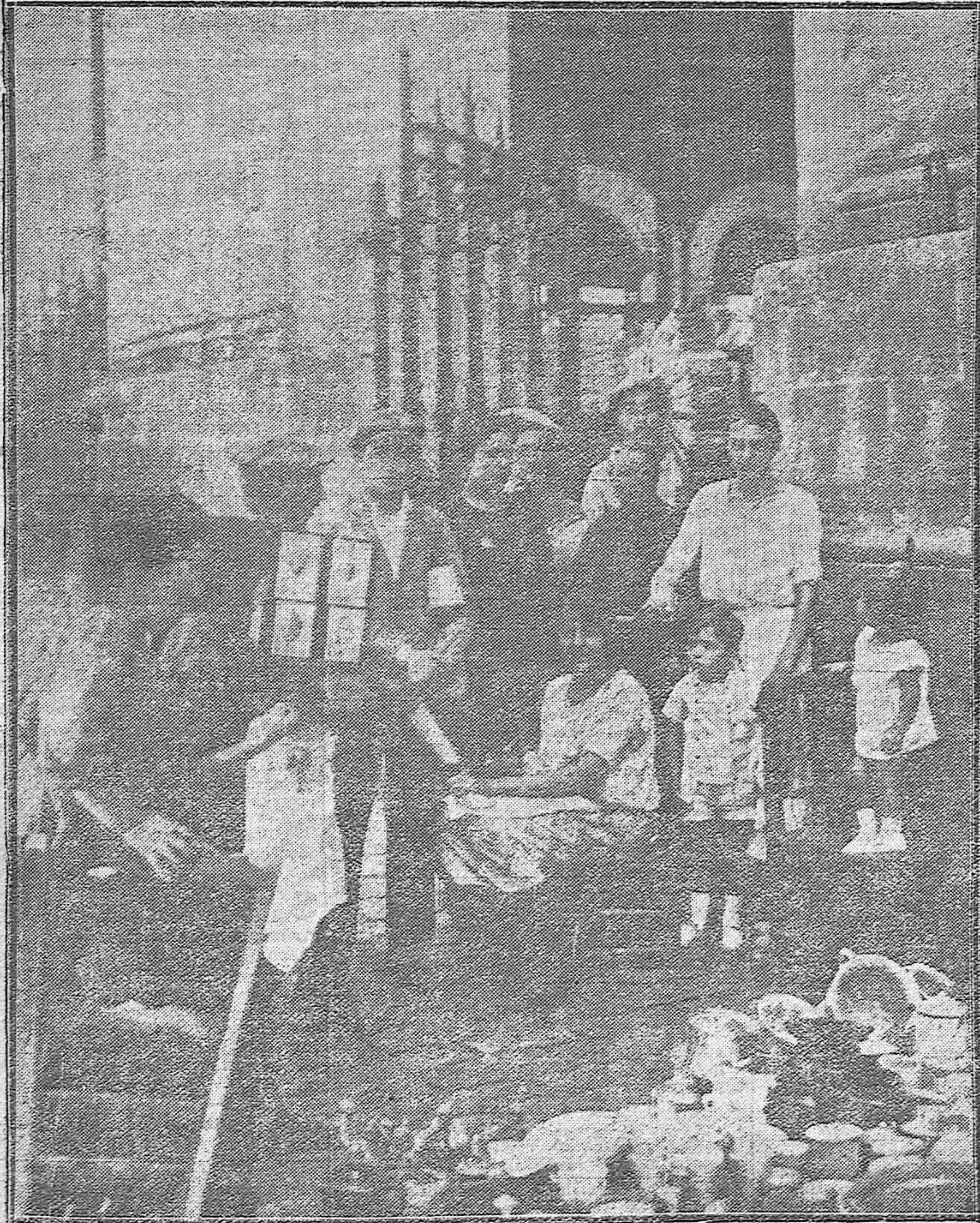
ESCENAS GRÁFICAS CORDOBESAS.--Un fotografo de "al minuto" ejerciendo su simplificado arte en la plaza de la Corredera.