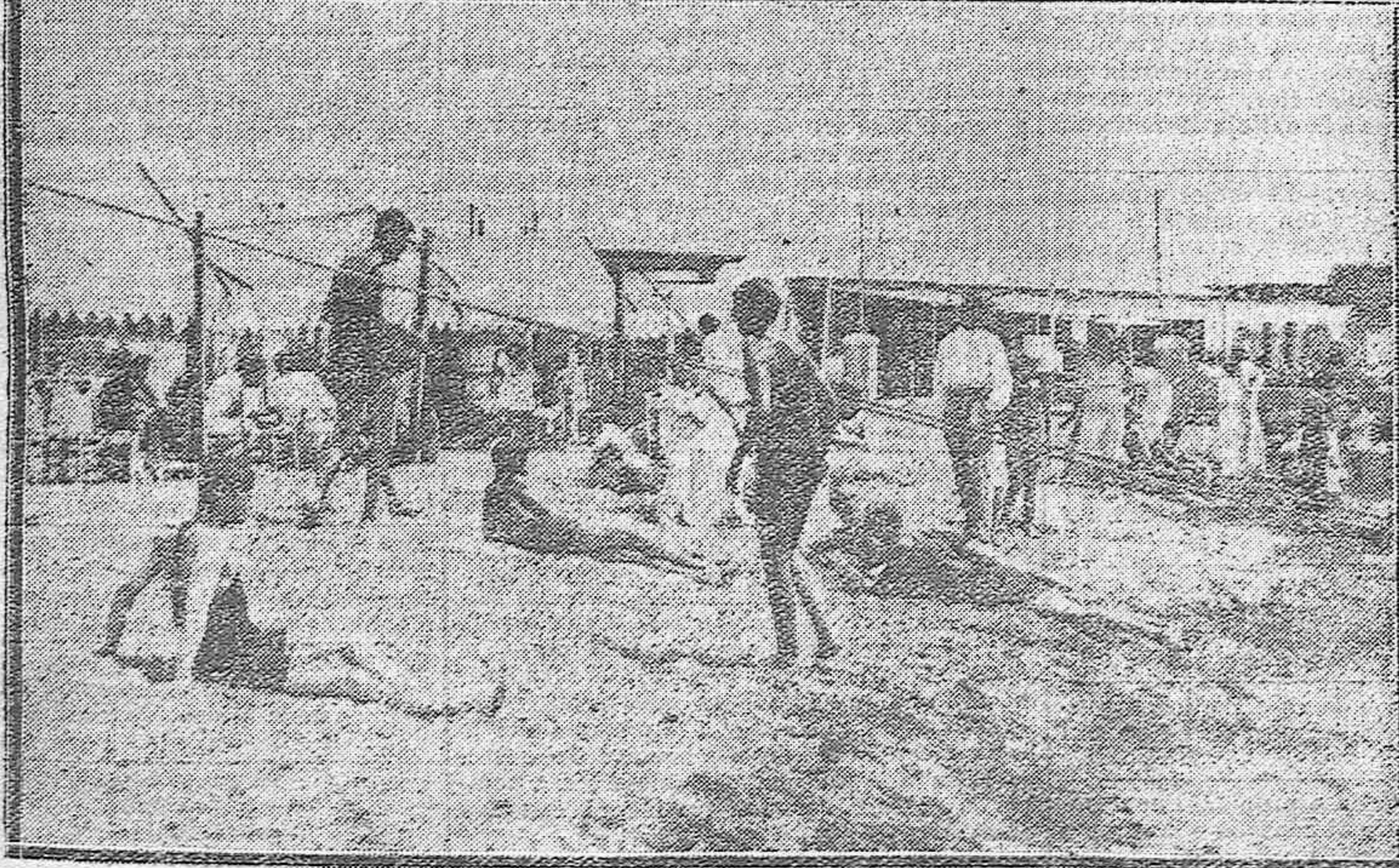
NOTAS GRÁFICAS MALAGUENAS.--Niños cordobeses jugando en la playa.--Vista de la playa del Carmen a la hora del baño.