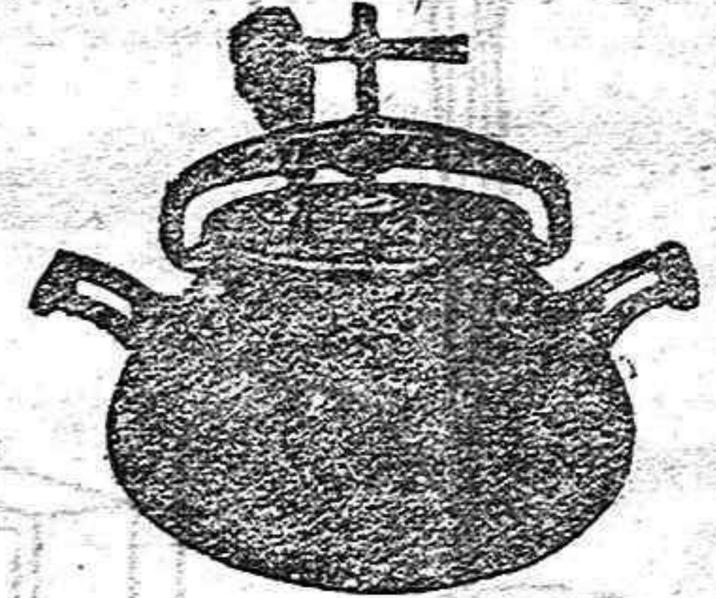
Marmita Hispano-Olla Exprés

Batería de cocina - Herrajes para obras y herramientas en general