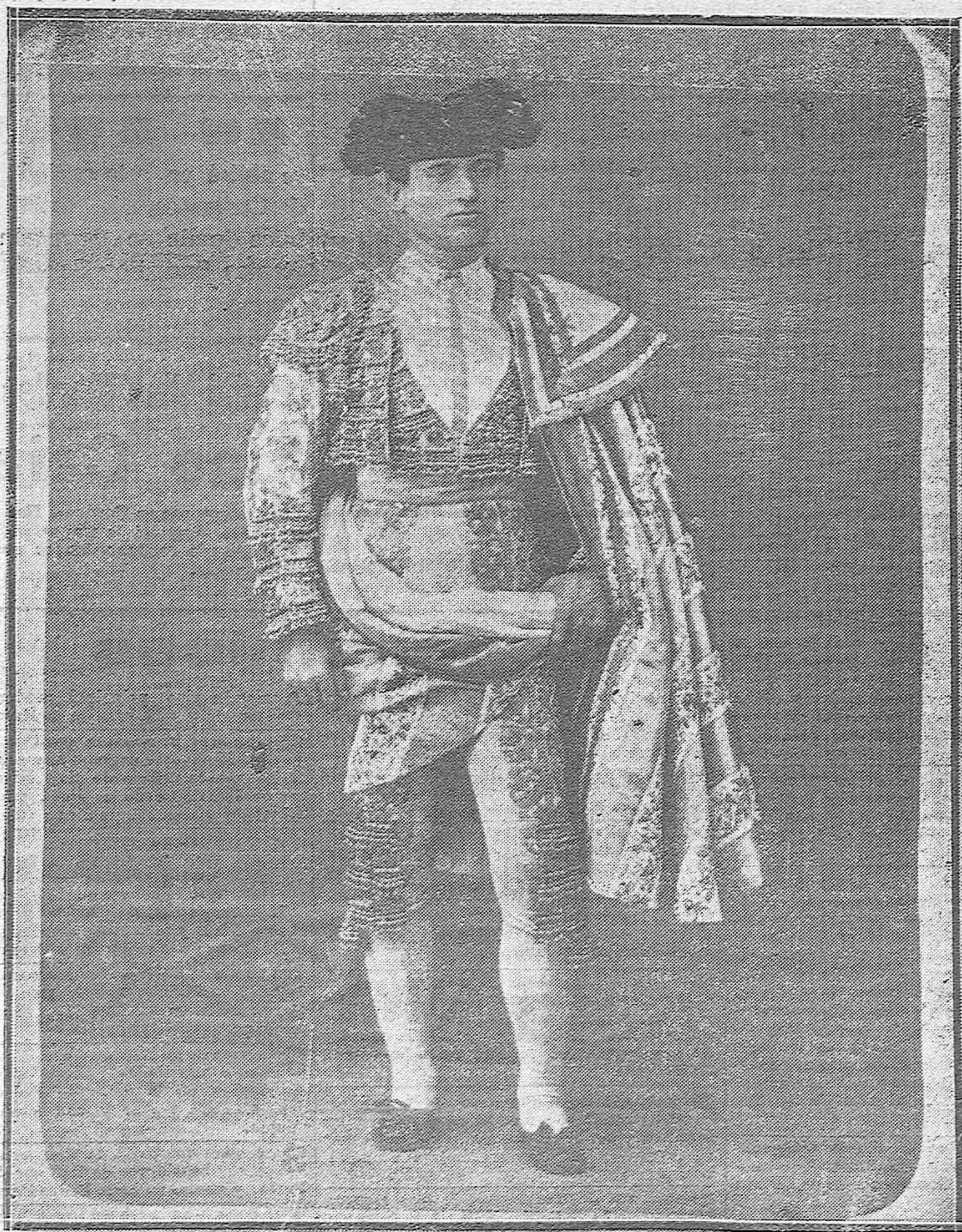
LAS GRANDES FIGURAS DEL TOREO ANTIGUO.--Rafael Molina Sánchez (a) Lagartijo, llamado también el grande y único, cuyo 25 aniversario de su muerte se cumple hoy.