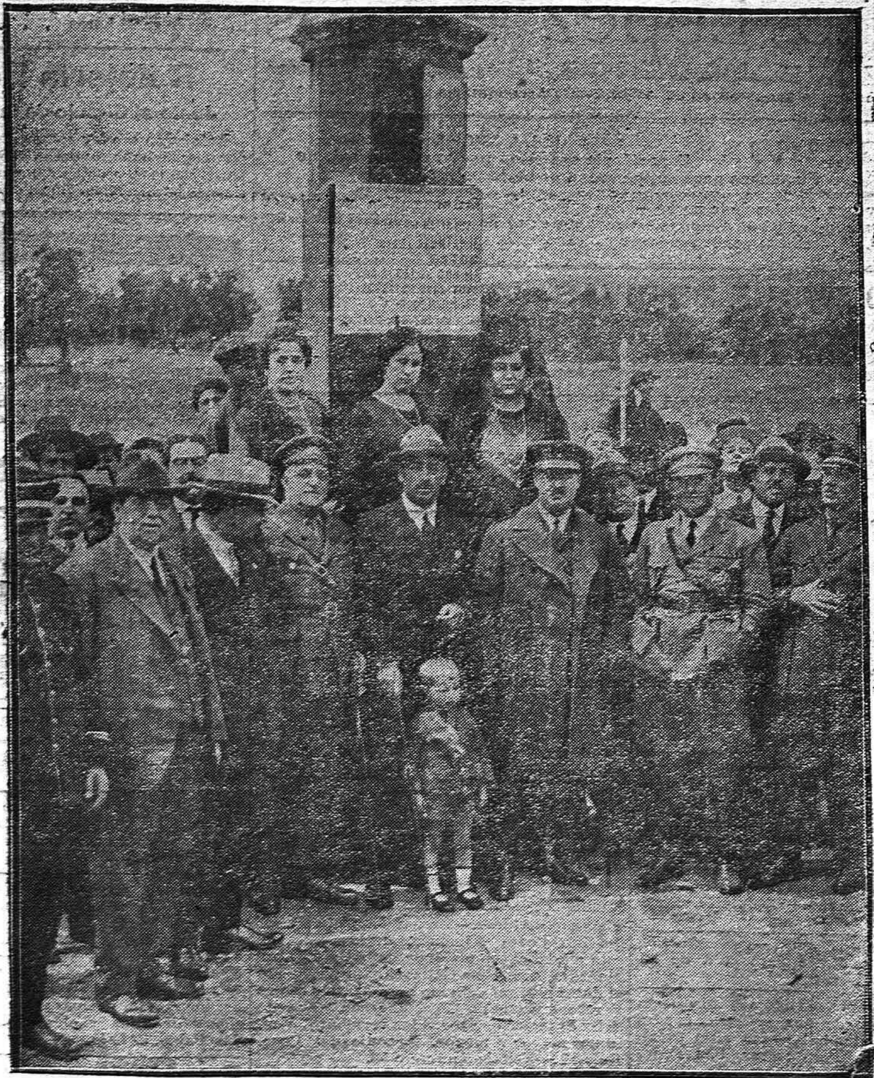
FUENTE OBEJUNA. --Las autoridades locales y provinciales ante la lápida dedicada al ilustre general Primo de Rivera, a la entrada de los puentes recientemente inaugurados.