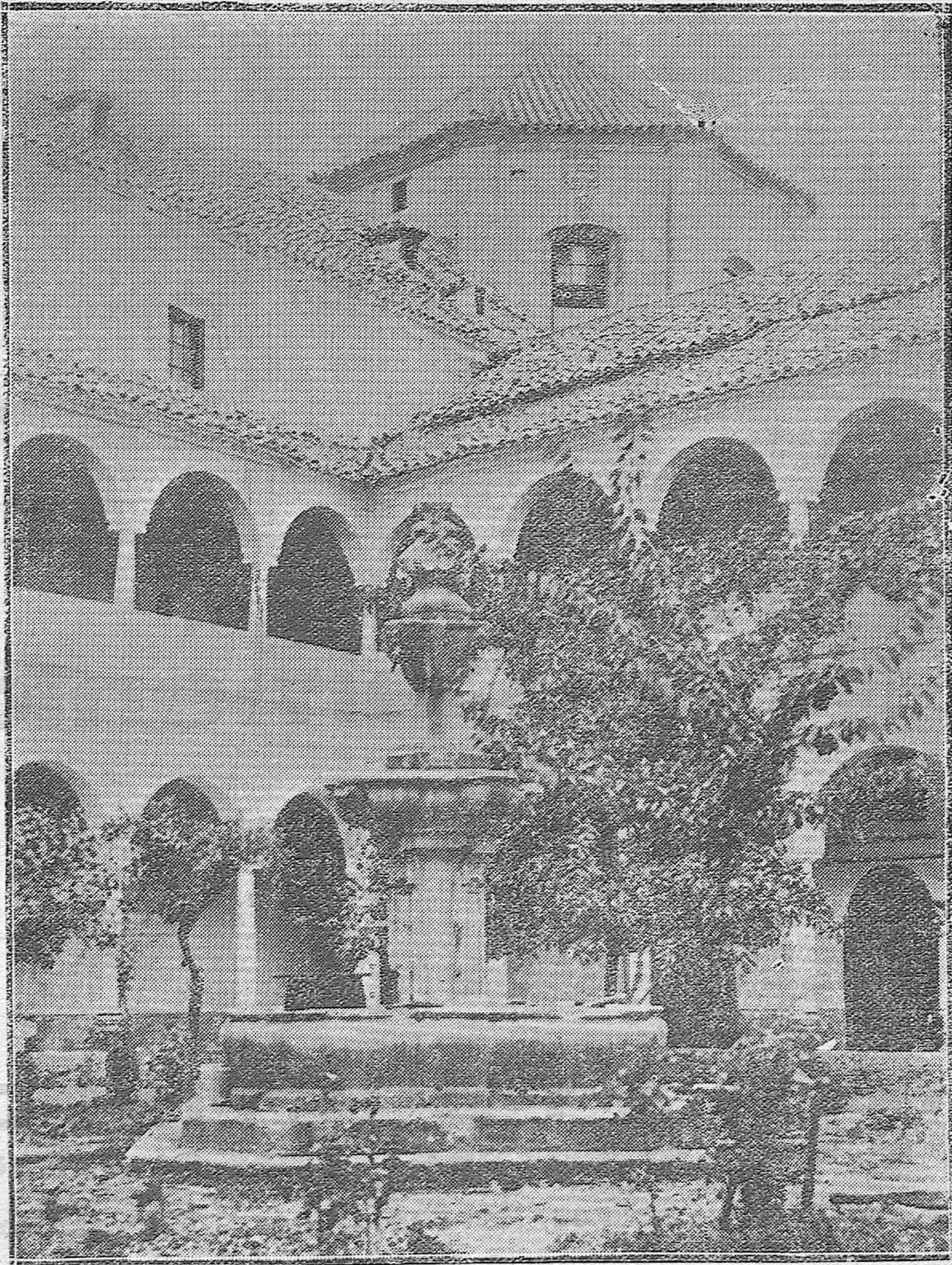
LUCENA.—PATIO Y CLAUSTRO DEL CONVENTO DE SAN FRANCISCO, DEL CUAL HAN DESAPARECIDO LOS MAGNIFICOS ARTESONADOS QUE MERCED A LA ACERTADA INTERVENCIÓN DE LA JUNTA DE MONUMENTOS VAN A SER RECUPERADOS.