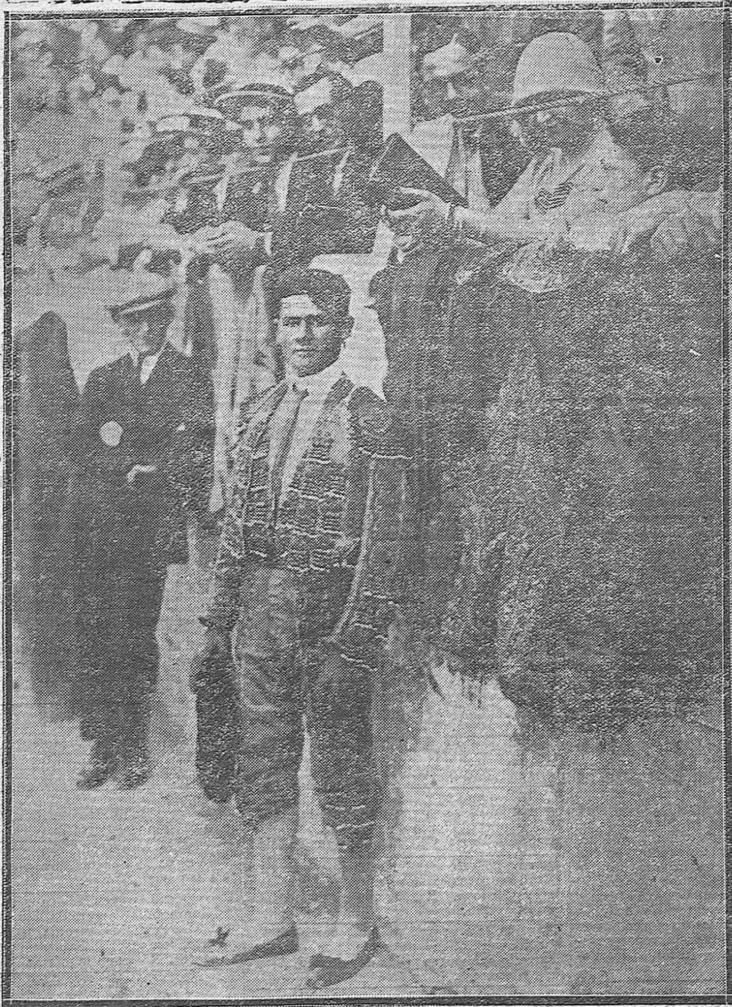
TIPOS POPULARES. ---«Simpatías» forero moderno extraordinario, verdadero fenómeno en el arte de Montes, que lleva conseguidos dos ruidosos «triumfos» en sus dos actuaciones.