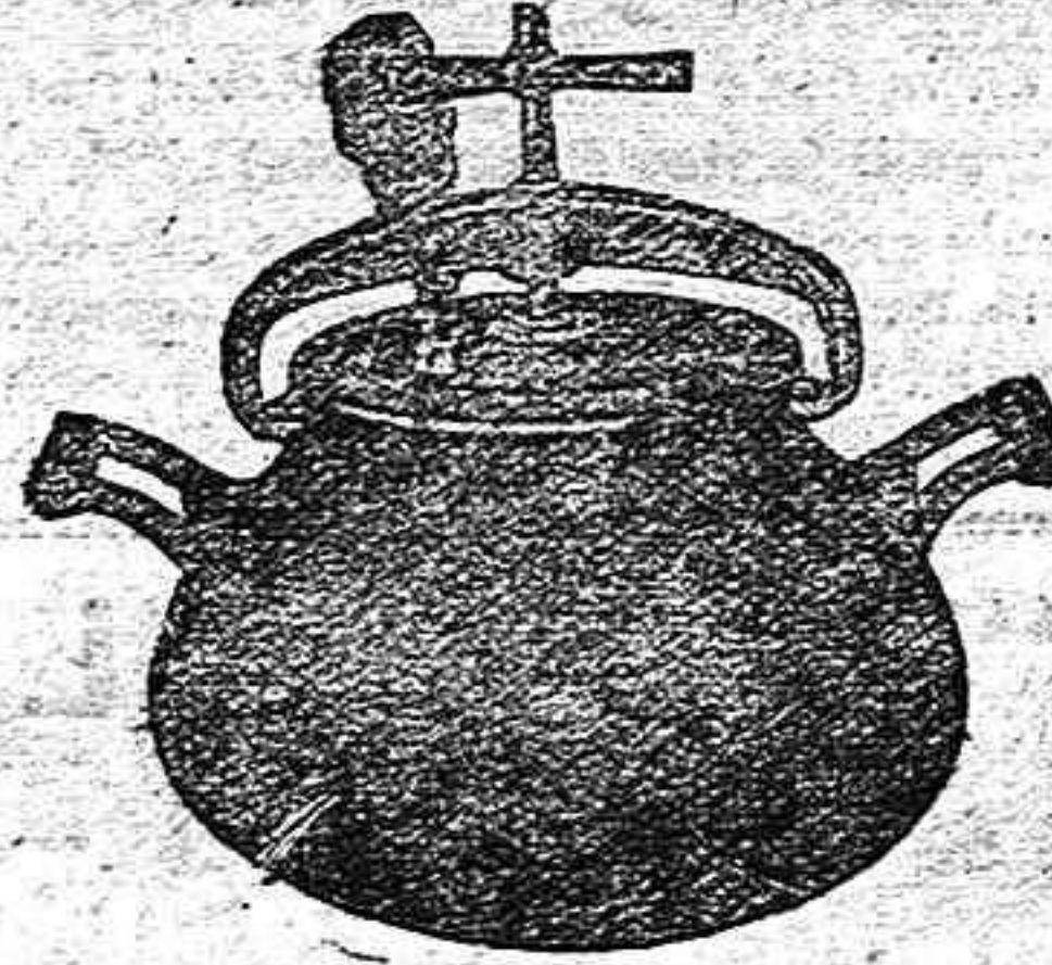
Marmita Hispano-Olla Exprés.

Batería de cocina - Herrajes para obras y herramientas en general