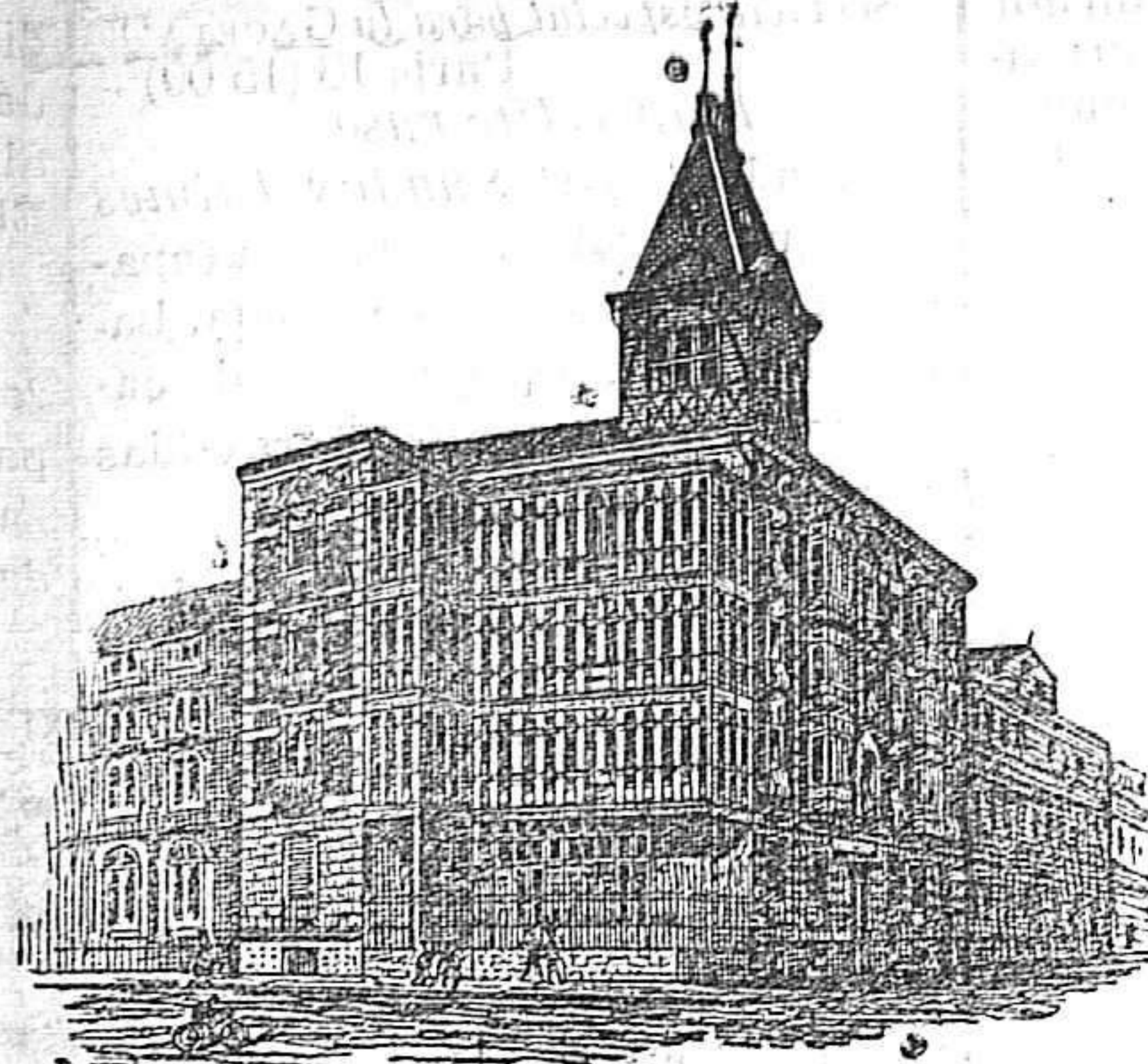
Edificio propio de la Sociedad en Pamplona