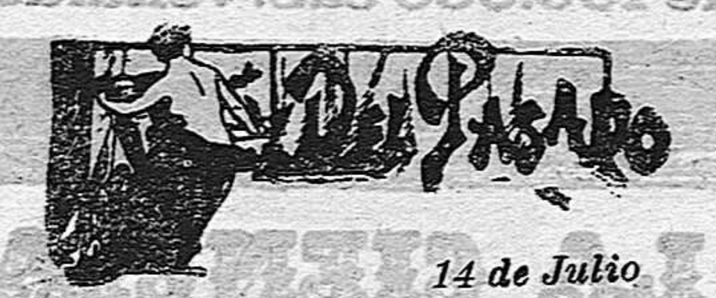
14 de Julio

factorias, y esa simiente envenenada que pretenden—no sabemos con qué objeto—sembrar los periódicos aludidos, no arraiga ni puede arraigar en el espíritu popular de dos naciones que, como Francia y España, están íntimamente unidas por intereses mutuos y firme y constante simpatía.