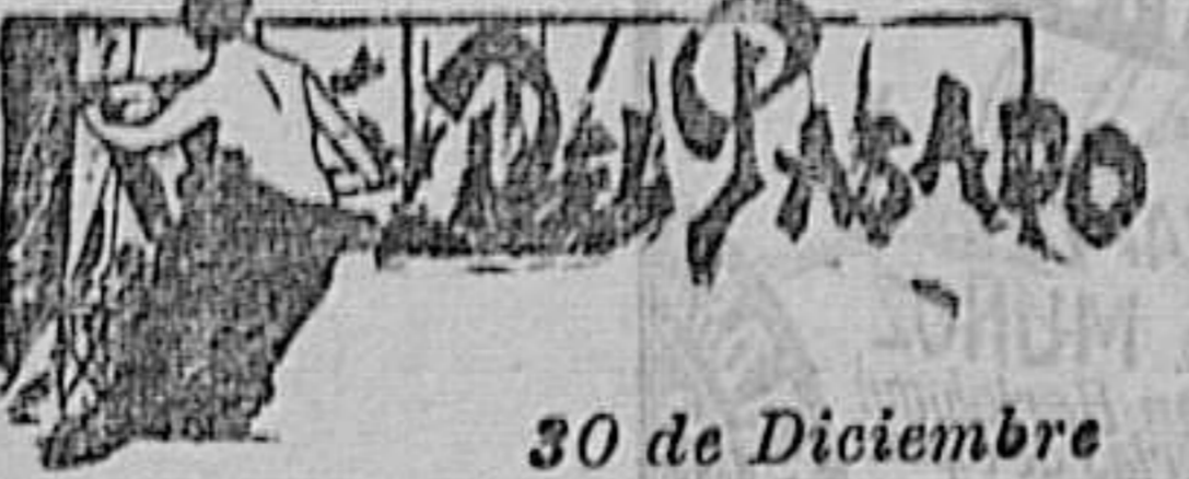
30 de Diciembre

PRECIOS MUY ECONÓMICOS Polavieja n.º 17 y San Mauro n.º 8