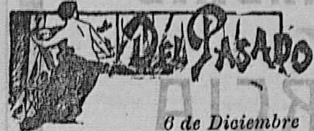
6 de Diciembre

Madrid 16 de Julio de 1910.—El Ministro de la Gobernación, Fernando Merino.