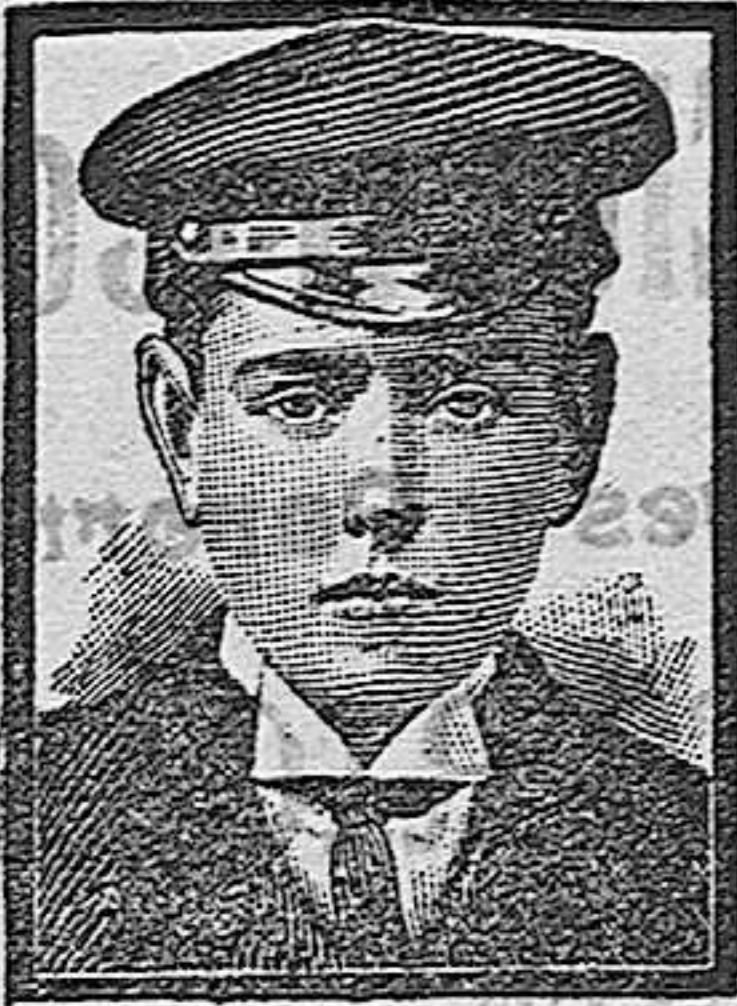
Barcelona, 11 Abril 1908. (Calle Condé Asalto nº 43.)

Santos de hoy.—San Andrés Avelino, confesor. Santos de mañana.—San Martín obispo y Santa Ernestina.