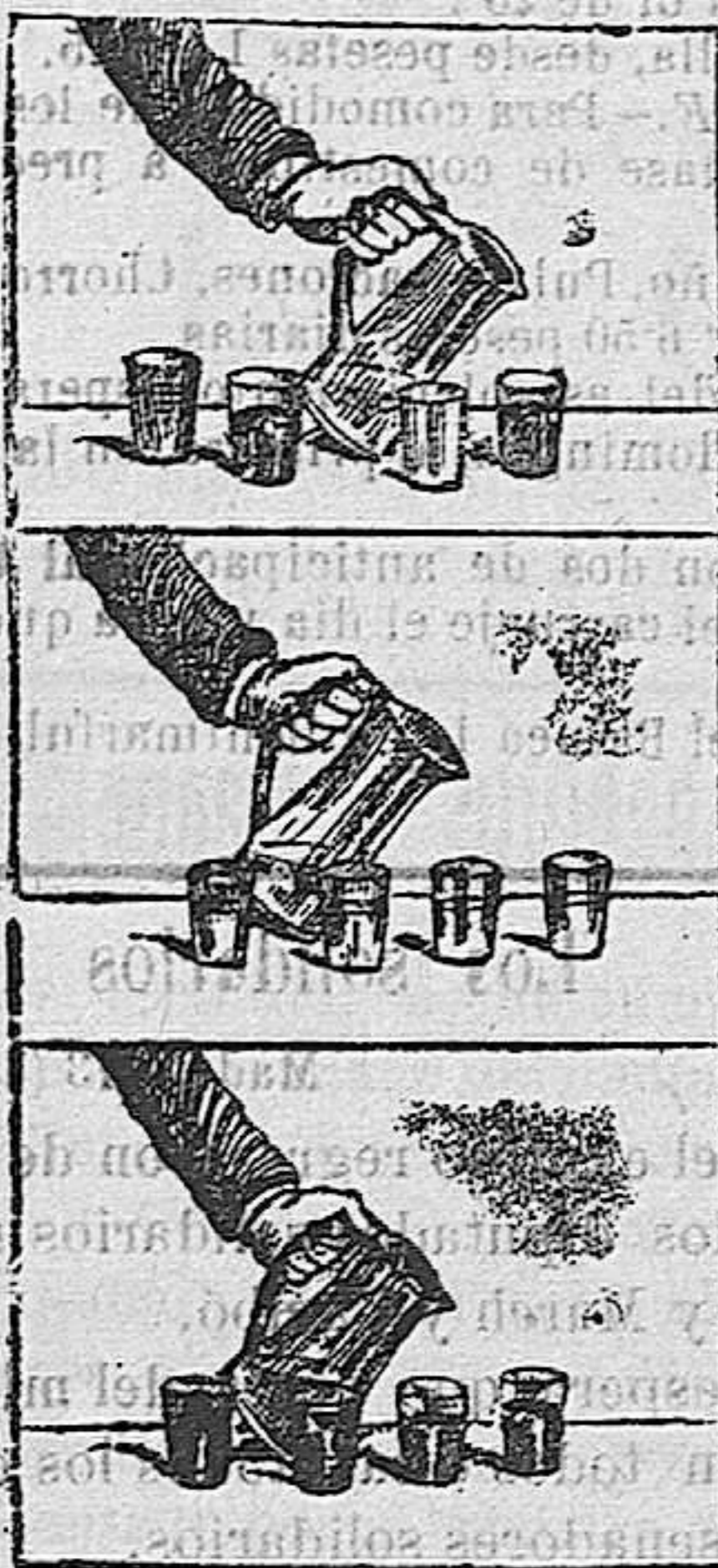
Modo de cambiar el agua por vino

Sobre una mesa se colocan cuatro vasos y un jarro de vidrio con asa, lleno de agua clara, ó que, al menos, lo parece.