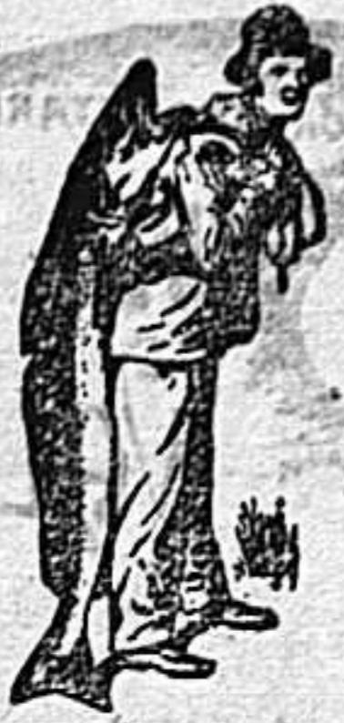
Obténgase siempre la Emulsión con esta marca "El Pescador", marca del procedimiento Scott.