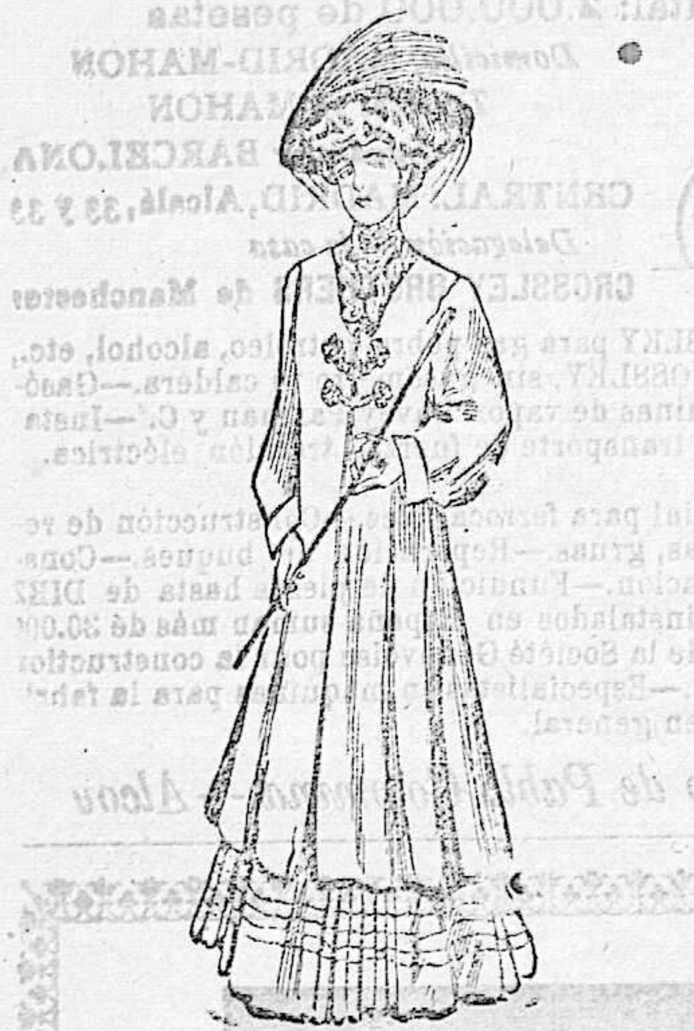
Abrijo para señorita. — De paño color crema. Cuello de terciopelo negro con bordado de seda blanca. Lo cierran dos bonitos broches de pasamanería. Manga ancha con vuelta en el puño.