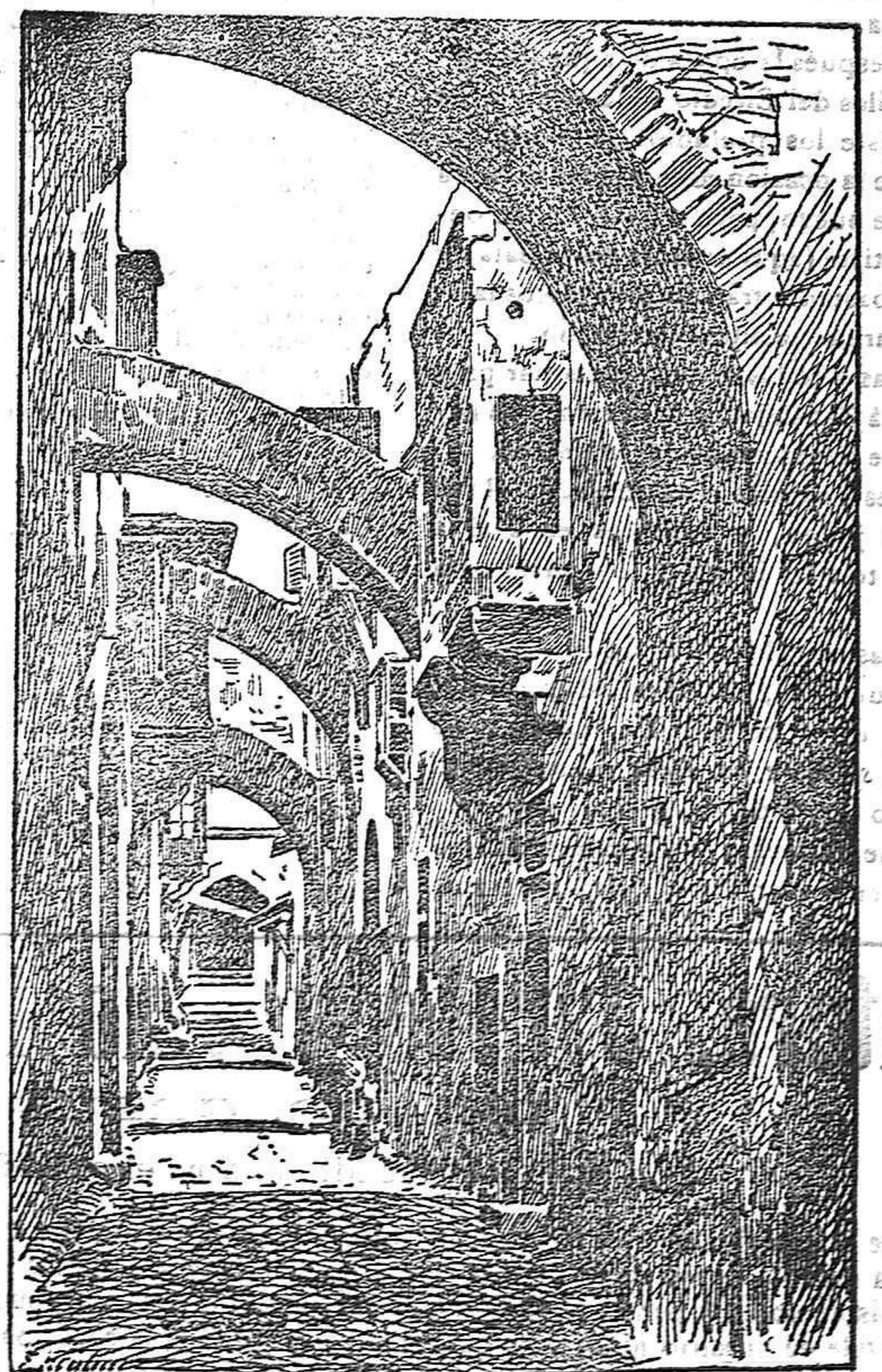
LA CALLE DE LA AMARGURA