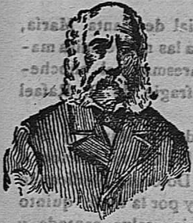
A. CHARLES LAMBERT PARÍS Depósito general: calle Aragón, 402, Barcelona