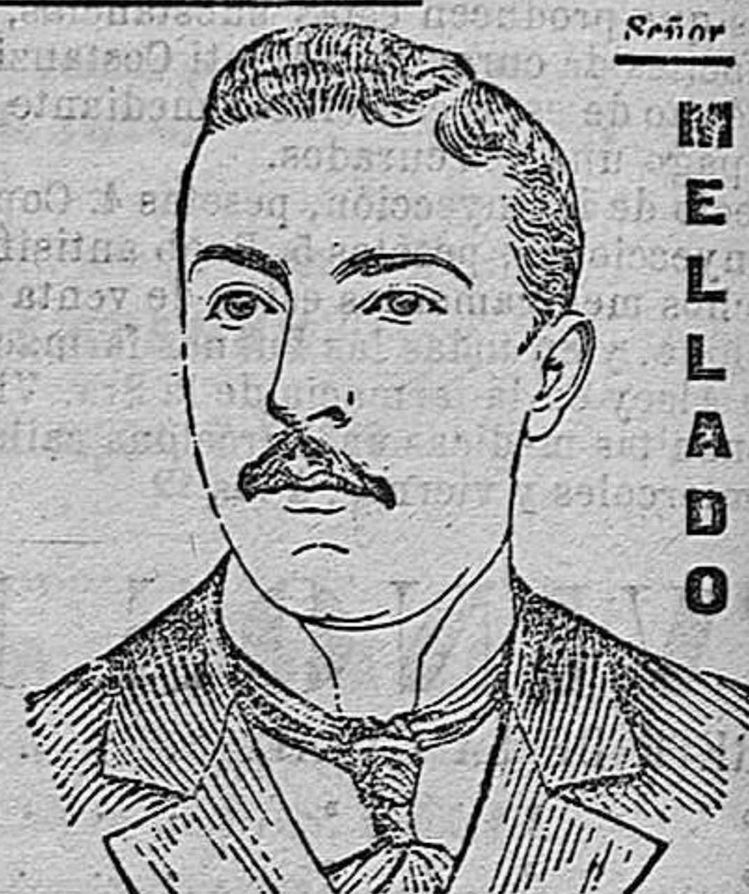
Madrid 21 de Abril de 1902.

Desde mucho tiempo hallábame en tal estado de anemia, desgano y debilidad general, que al salir á paseo al poco rato la fatiga me tendía. En ese estado me aconsejaron de tomar la Emulsión Scott, y en verdad el resultado ha sido lo más satisfactorio. Unas cuantas botellas me han bastado para restablecerme. La anemia ha desaparecido, he recuperado un buen apetito, y con él las carnes y fuerzas perdidas. Considerándome ahora completamente curado gracias á la inapreciable Emulsión Scott.