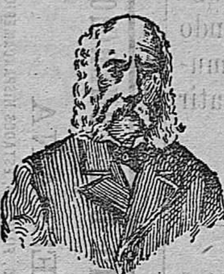
A. CHARLES LAMBERT PARÍS